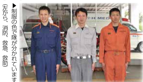
▶制服の色で隊が分かれています 左から、消防、救急、救助