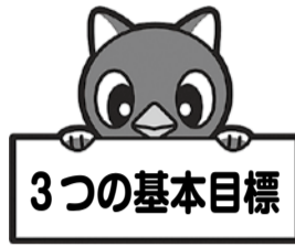
▲市キャラクターやっち

市民の皆さんの生涯を通じた健康づくりを推進するため、第2次健康まちづくりプランを策定しました。 平成16年度から推進してきた健康まちづくりプランの総括評価、国の健康日本21(第2次)や23年度実施の市民アンケートなどを踏まえて策定し、25年度から34年度までの10年を計画期間としてプランを推進します。