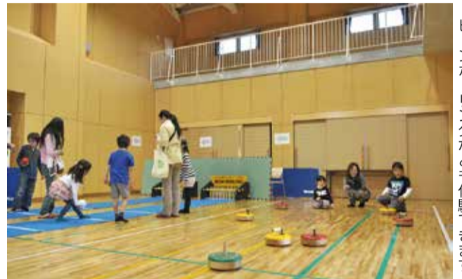
▶フロアーカーリングの他に、ペタンクやピンボールリングなども体験できます

皆さんはフロアーカーリングを知っていますか。季節や天候に左右されない室内競技の一つで、カーリングのストーンにあたるキャスター付きのフロッカーでターゲットを狙い、得点を競います。4月6日・7日、勝田台中央公園小体育館のオープニングイベントでニュースポーツ体験会を実施。参加者は思い通りに進まないフロッカーの扱いに苦戦しつつも、和気あいあいと楽しんでいました。同館では道具の貸し出しを行っています。