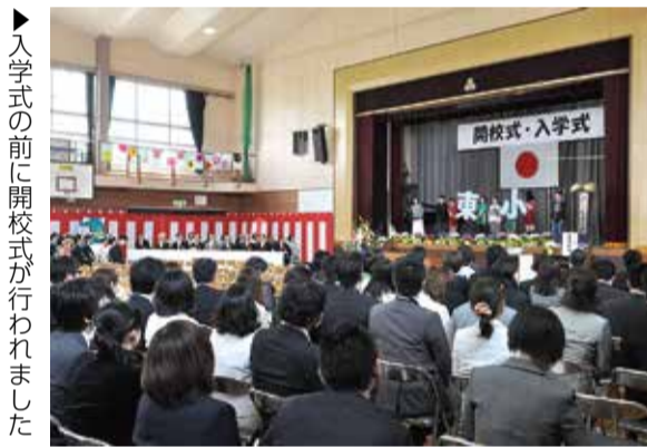
▶入学式の前に開校式が行われました

開校式では、市教育委員長が「楽しい学校を先生方と一緒に作っていきましょう」と開校宣言。児童の代表も「これまでの二つの学校の伝統の上に、新しい八千代台東小学校をつくっていきます」と決意を表明しました。児童数は同日に入学した新1年生103人と合わせて567人となりました。