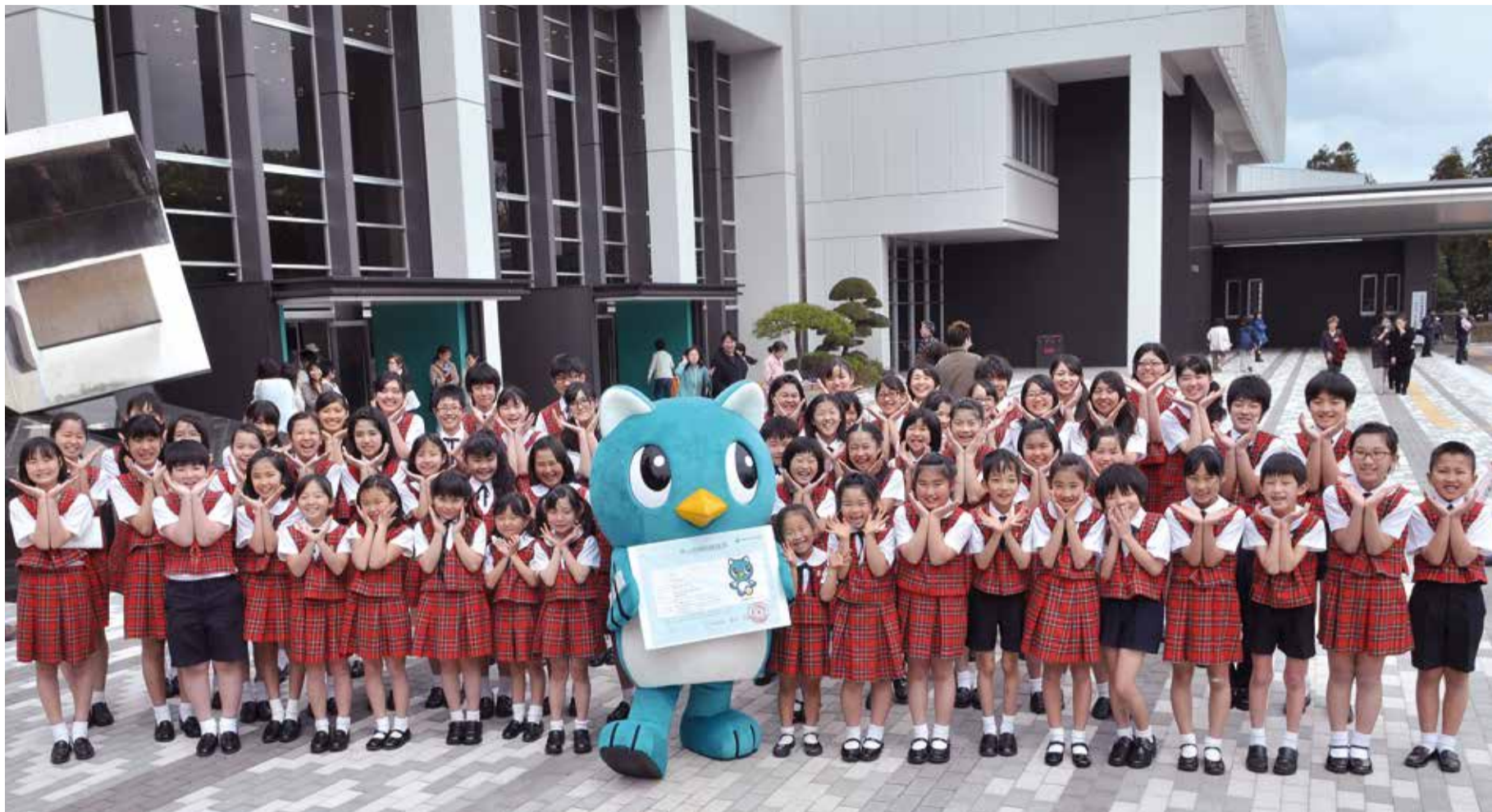
▲記念コンサートに出演した八千代少年少女合唱団の皆さんと。「やっち」の特別住民票は市ホームページからダウンロードできます