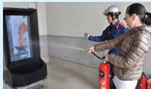
▲火を使わない訓練専用の画面で消火体験ができます