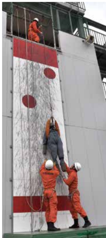
▲谷底などの低所にいる要救助者を救出する訓練

消防隊、救急隊、救助隊が、それぞれ消火や救助などの訓練をします。素早く、確実に使えるように、器具の使い方の練習もします。