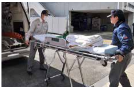
▲ストレッチャーの点検

車両に積載している資機材を、いつでも使えるよう毎日点検。破損や異常はないか、正常に作動するか、燃料は十分かなど、細部まで点検します。