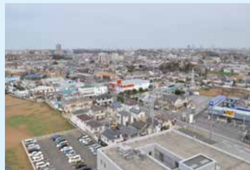
▲地上40メートルから市役所方面を見た景色