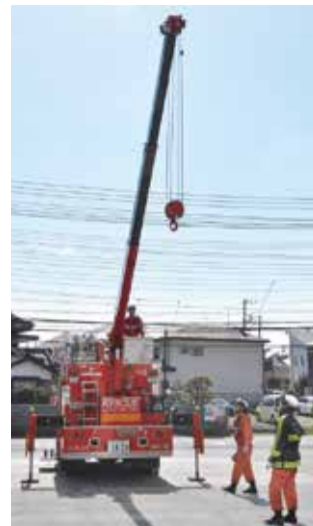
▲救助工作車のクレーン動作確認