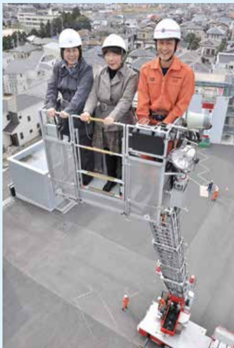
▲高所の人命救助で活躍するはしご付消防自動車。地上40メートルまでの建物に対応できます