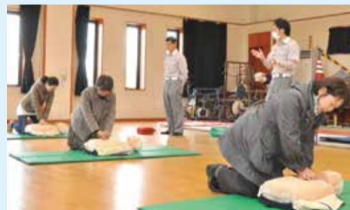
▲トレーニングマネキンで心肺蘇生法を体験

●消防署では、消防庁舎見学、消防車両見学をはじめ煙中避難体験、消火訓練体験などを行うことができます。希望する人は、中央消防署 458-0119 へお問い合わせください。