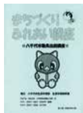
▲25年度版のパンフレット

各講座の詳しい内容は、生涯学習振興課、支所、公民館などに置いてある「まちづくりふれあい講座」のパンフレットまたは市ホームページをご覧ください。