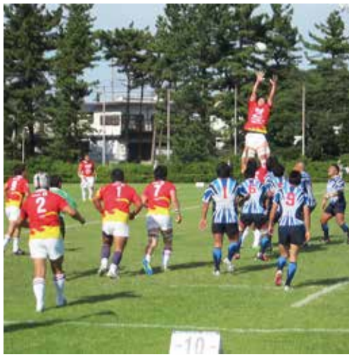
▲日本I・B・M八千代台グラウンドで行われたラグビーの試合