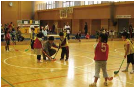
▲総合型地域スポーツクラブの「八千代中央コミュニティスポーツクラブ」が主催したユニホッケー大会

これらのクラブの広報活動や環境整備を支援することで認知度を高め、加入者の増加や各地域での設立につなげます。