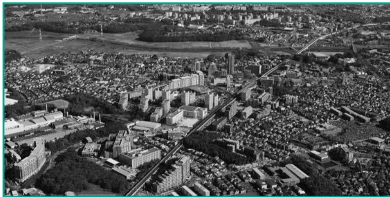
▲発展する八千代市。市民活動団体に皆さんからの支援をお願いします。八千代中央駅周辺から、新川・村上団地方面を望む

納税通知書等の番号が分からない場合は、市が調べて番号を記入します。本人であることが