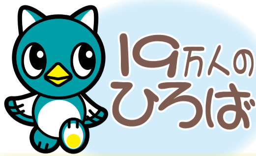
八千代市イメージキャラクター「やっち」