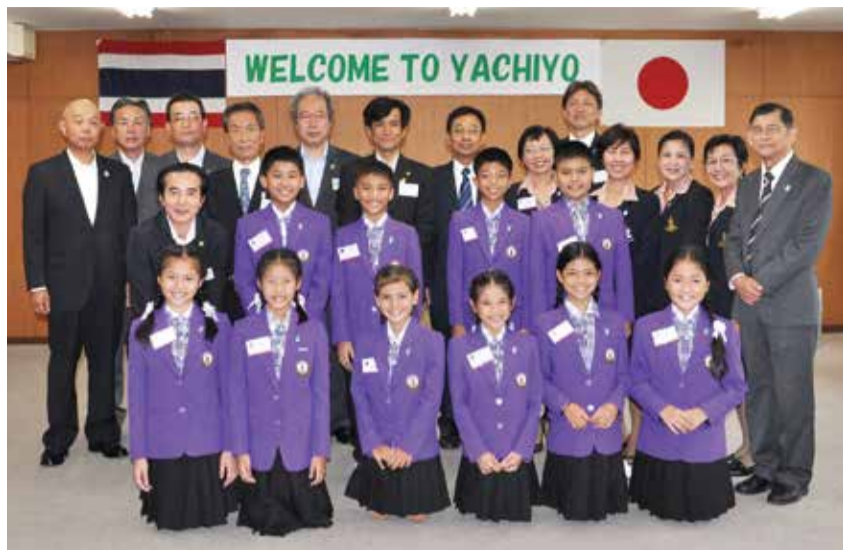
▲5月30日は秋葉市長(後列左から6人目)を表敬訪問しました

5月29日～6月4日、バンコクこども親善大使10人が八千代市を訪れました。30日に文化伝承館で茶道を体験。30日・31日には、みどりが丘小学校を訪問し、書道・空手などの授業を体験しました。一緒に給食を楽しんだ後、お互いの歌や踊りを披露する交流会を開催。6月4日にはスカイツリーを見学し、高さ350メートルからの景色に目を奪われていました。ほかに、歴代の八千代こども親善大使の会「ダ