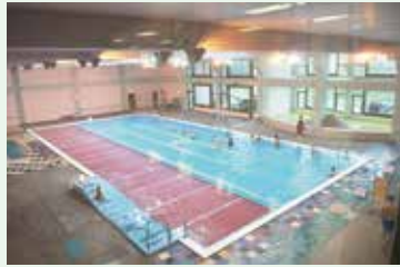
年中使える屋内プール

プール、アスレチック室、体育室、浴室には、100円硬貨が戻るリターン式のコインロッカーを設置しています。 ■温水プール 有料 25メートルプールと幼児用変形型プールがあります。市内在住・在勤の4歳～中学生と60歳以上の人は2時間200円、高校生～59歳の人は400円。午後8時まで。