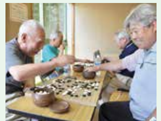
60歳以上の市民が利用できる娯楽室

■娯楽室 無料 風呂上がりの休憩や囲碁・将棋などに。カラオケや親睦会などの団体利用もできます。