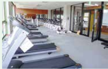
アスレチック室は無料