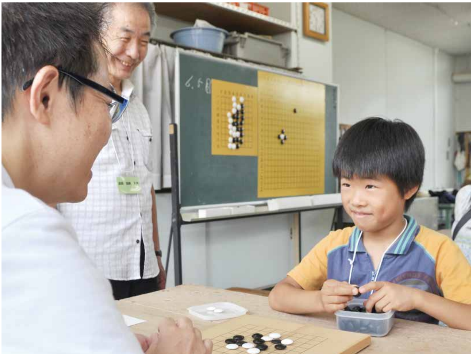
▲お父さんの表情を見ながら「次の手」を考えます。囲碁は言葉を使わずに互いの意思が通じあえることから「手談」ともいわれています

高津公民館では、昨年から囲碁講座を開催しています。子どもを対象に始めましたが、「親子でやりたい」との声が上がり、今年度から、全10回の親子囲碁講座として実施しています。2回目の7月6日は、「ゲタ」「シチョウ」など相手の石の取り方を学びながら親子で対局。合間には、囲碁クイズなどもあり、楽しむうち、あっという間に講座の時間が終わってしまいました。