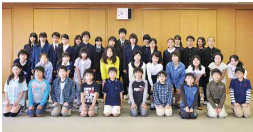
5月12日に市役所で委嘱式が開催されました

市内の小・中・高校の推薦で、25年度の広報青少年版記者41人が選ばれました。特集テーマに沿った自分の考え、学校での出来事や話題、新聞やニュースで気になることを報告。今年度は、今号、11月15日号、26年2月15日号に掲載します。