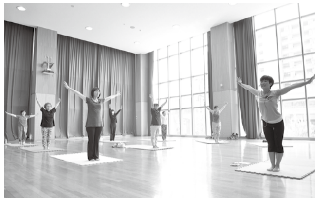
◀三方を体験して心身にリフレッシュ

総合生涯学習プラザは、温水プール、アリーナ、トレーニング室、多目的ホールなどの「場所の提供」だけでなく、講座や講演会の開催、生涯学習の相談や情報提供なども行っています。多様化する皆さんの学習意欲に応えるため、ボランティアで「教えたい人」と「教わりたい人」を結びつける生涯学習ボランティアバンク制度を21年1月に開始。豊かな経験、専門知識や技術を地域社会に役立てたいと考えている人と、学習支援を受けたい人の橋渡しをしています。