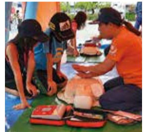
※荒天時は中止 ▲心肺蘇生法訓練の様子

今年のテーマは「いざ、減災」。総合運動公園多目的広場で午前9時30分～正午に実施します。大地震を想定したトリアージ訓練や、体験コーナー、緊急車両の展示なども。小学生以下を対象にしたスタンプラリーを実施し、先着100人に市イメージキャラクター「やっち」のピンバッジをプレゼントします。