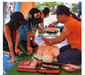
※荒天時は中止 ▲心肺蘇生法訓練の様子

今年のテーマは「いざ、減災」。総合運動公園多目的広場で午前9時30分～正午に実施します。大地震を想定したトリアージ訓練や、体験コーナー、緊急車両の展示なども。小学生以下を対象にしたスタンプラリーを実施し、先着100人に市イメージキャラクター「やっち」のピンバッジをプレゼントします。