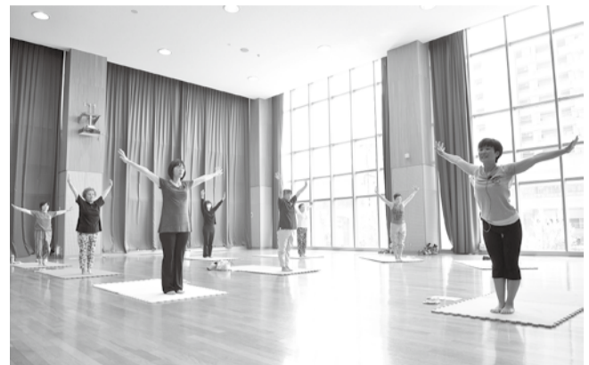
◀三方を体験して心身にリフレッシュ

総合生涯学習プラザは、温水プール、アリーナ、トレーニング室、多目的ホールなどの「場所の提供」だけでなく、講座や講演会の開催、生涯学習の相談や情報提供なども行っています。多様化する皆さんの学習意欲に応えるため、ボランティアで「教えたい人」と「教わりたい人」を結びつける生涯学習ボランティアバンク制度を21年1月に開始。豊かな経験、専門知識や技術を地域社会に役立てたいと考えている人と、学習支援を受けたい人の橋渡しをしています。