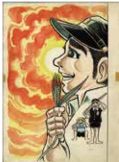
▲「はだしのゲン」第1巻の表紙絵

【講話・演奏】▶日時/場所 9月23日(祝)午前10時15分～11時45分/勝田台文化センター音楽室 ▶申し込み 当日直接会場へ