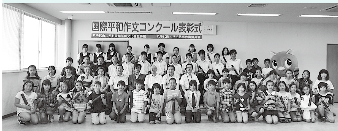
▲7月10日に表彰式が行われました

入選作品をまとめた作文集「君たちを忘れない」第25集は、26年3月頃から市内の図書館で閲覧できます。また、入選者の中から選ばれた八千代子ども親善大使10人(*印が付いた児童・生徒)が、友好都市バンコク都を訪れます。