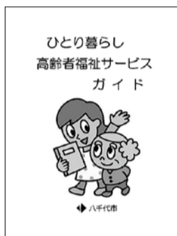
▲ひとり暮らし高齢者福祉サービスガイド