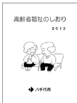
▲高齢者福祉のしおり

今回紹介したサービスの詳しい内容や、その他のサービスについては、「高齢者福祉のしおり」「ひとり暮らし高齢者福祉サービスガイド」をご覧ください。長寿支援課窓口、または各地域包括支援センターで配布しています。いずれも、市ホームページでもご覧になれます。