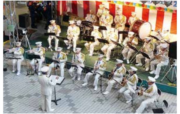
▲消防音楽隊の演奏

▶日時 11月3日(祝)午前11時～午後4時。 雨天のときは内容を縮小して実施 ▶主なイベント 幼年消防クラブの演奏、はしご車搭乗体験、消火体験、AED取扱体験、応急手当体験、消防音楽隊の演奏、消防クイズ、消防救助隊員による救助演技など。消防団の車両や赤バイの展示などもあります ▶場所 フルルガーデン八千代 ▶問い合わせ 消防総務課☎459-7802