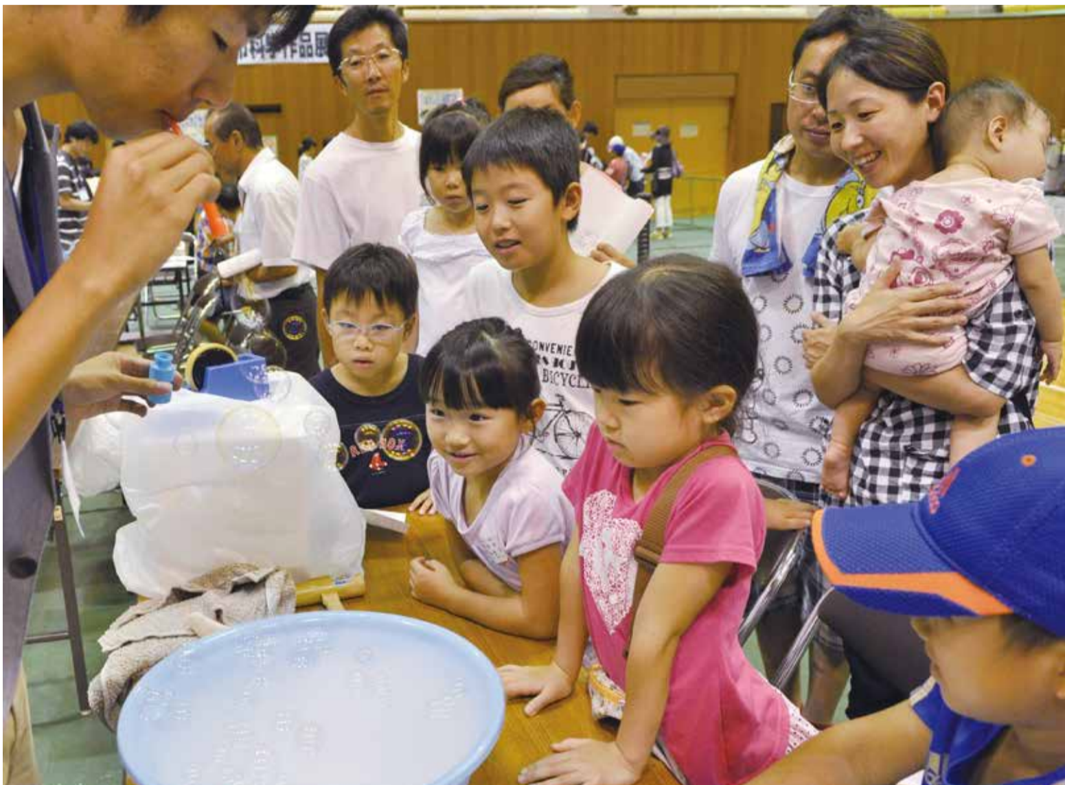
▲ドライアイスを使ってシャボン玉を浮かせる実験。シャボン玉の浮かんでいる様子に、子どもたちは目を輝かせながら観察していました

9月14日・15日、市科学作品展が行われ、2,000人以上が訪れました。展示の規模が年々拡大し、今年は市民体育館で開催。市内の小中学生が取り組んだ科学作品・論文323点が並びました。学校の先生や学生スタッフが、実際に動かしたり質問に答えたりしながらアイデアの「売り」を説明。このように紹介するスタイルは全国的にも珍しい試みとのこと。見るだけの展示ではないのが特徴です。