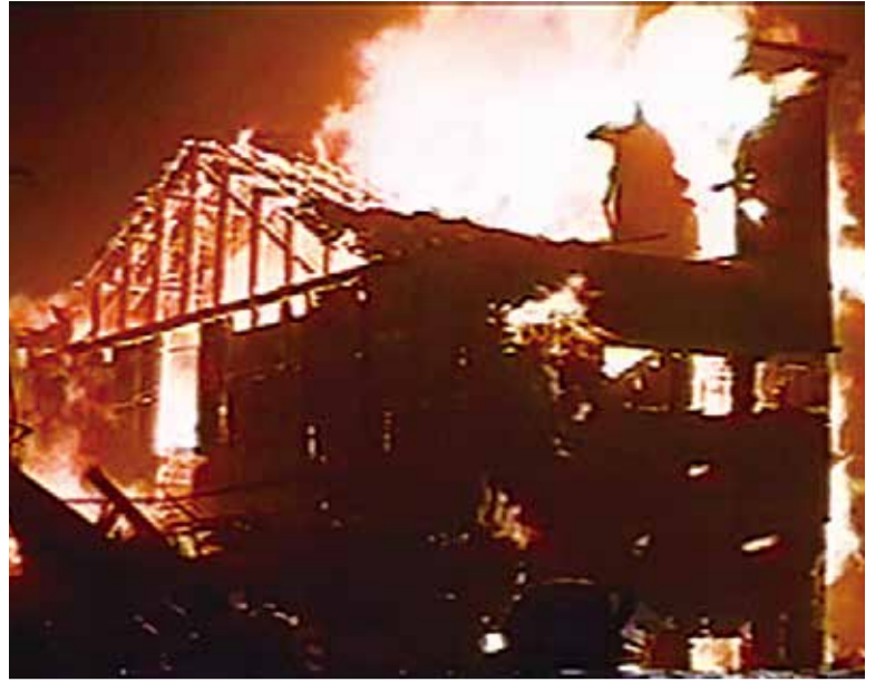
▲燃えあがる家屋

万一のとき、周囲に火事を知らせる住宅用火災警報器（以下、住警器）。肝心なときに作動するよう、定期的に点検してください。