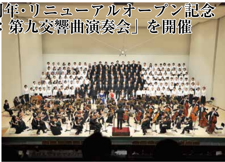
▲ソプラノ・アルト・テノール・バスのパートに分かれて合唱。第1部では八千代少年少女合唱団が「赤とんぼ」など5曲を披露しました

「歓喜の歌」として日本人に馴染みの深い“第九”。市民会館の開館40周年とリニューアルオープンを記念して、9月23日、「ベートーヴェン：第九交響曲演奏会」が行われました。第九を披露したのは、この日の演奏会のために結成された「八千代第九合唱団」のメンバー。八千代市または近隣市に住む161人が一般公募で集まりました。4月7日に結団して以来、約半年間に30回に渡る練習を重ねてきました。中には合唱も第九も全く初めてという人もいましたが、短期間で集中して正しい発声や発音を学んだそうです。満を持して迎えた本番の日。会場は2階席まで観客