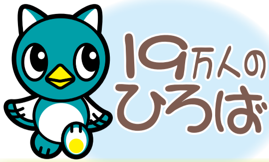
八千代市イメージキャラクター「やち」