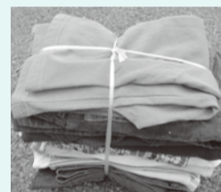
◆布類(古着、タオル、毛布、シーツなど)

▲再利用できないような汚れたもの、綿が入ったもの、臭いのついたもの、破れたものは可燃ごみで出してください