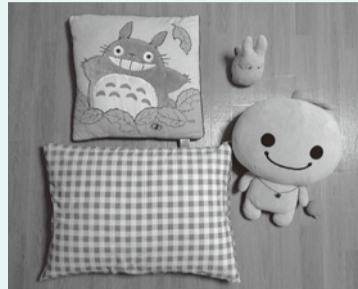
◆枕・座布団・ぬいぐるみなど