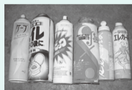
◆缶類(食品の缶、スプレー缶、カセットボンベなど)

▲スプレー缶は火気のない屋外で完全にガスを抜いてください。そのあと穴を開けてください