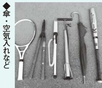
◆傘・空気入れなど