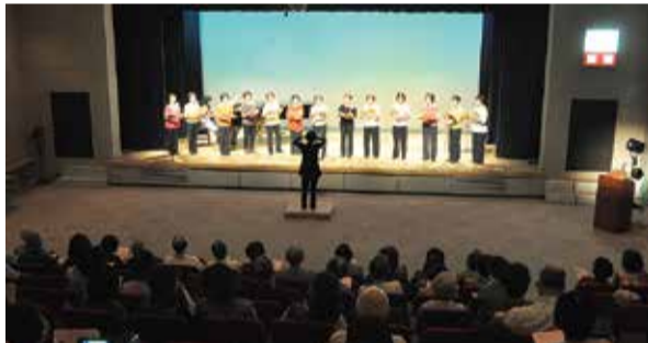
▲童謡唱歌をうたう会は「しゃぼん玉」など8曲を熱唱

10月12日、勝田台公民館まつりが、勝田台文化センターで行われました。演技発表のこの日は、人形劇やコーラス、ギターアンサンブルなど公民館のサークル活動で練習を重ねた12団体が日頃の成果を披露しました。公民館まつりは、市内全公民館で開催。昨年に引き続き行われた、災害時に役立つアルミブランケットなどの景品が当たるスタンプラリーにも多くの参加がありました。