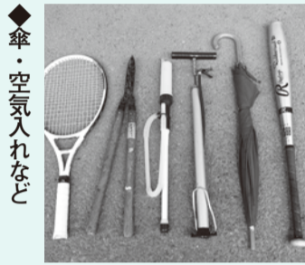
◆傘・空気入れなど