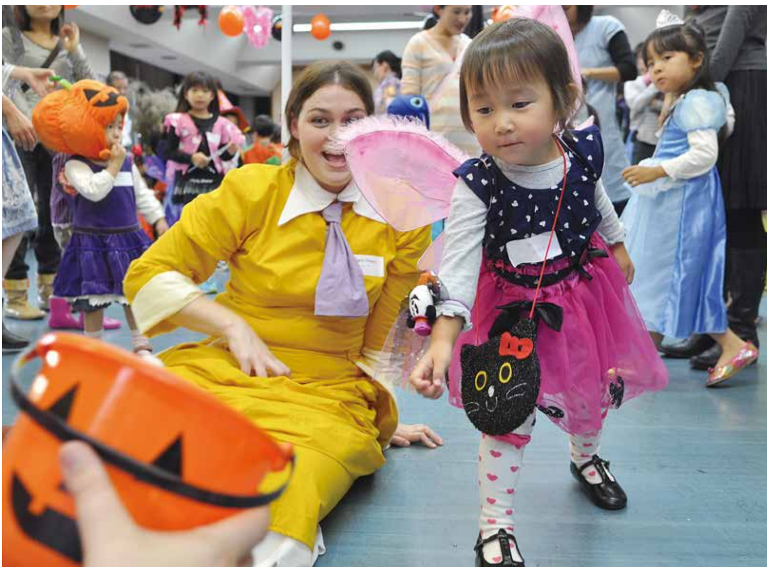
▲背中に羽を付けて妖精に変身した女の子。カボチャお化けのバケツをめぐってボールを投げ、ALT(外国語指導助手)からお菓子を受け取りました

カボチャのお化けや仮装などでおなじみのハロウィンにちなんだ「英語で遊ぼう、ハロウィンのお祭り」が10月26日、福祉センターで行われました。市国際交流協会が主催したもので、お化けや魔女、映画のキャラクターなどに扮した親子50組が参加し、ALTと一緒に英語を使ったゲームやダンスを楽しみました。「トリック・オア・トリート(お菓子をくれなきゃ、いたずらするぞ)」と教わったばかりの英語を話す子どもたち。無事にお菓子を受け取り「ありがとう」とにっこり笑顔を見せました。お揃いの手作り衣装で参加の親子の姿もあり、西洋起源のお祭りも親子で楽しめるイベントとして定着しつつあるようです。