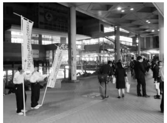
▲のぼりを持って声をかける生徒。啓発用のウェットティッシュを配りました

10月18日に高津中・東高津中学校の生徒と不法投棄連絡員が八千代緑が丘駅、八千代台駅で不法投棄防止を呼びかけました。