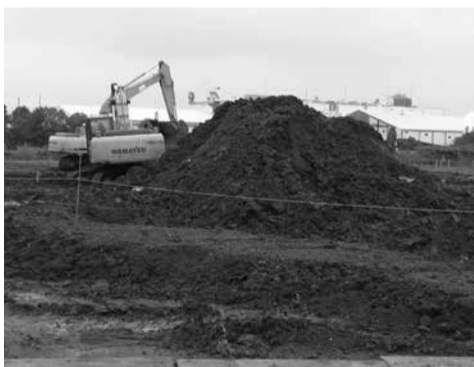
埋め立てには許可が必要です