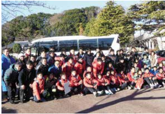
▲昨年来日した韓国チーム

12月に開催される第23回コミュニティワールドカップサッカー in 八千代。国内外の中学生チームが八千代市に集まり、熱い戦いを繰り広げる市内最大のサッカーイベントです。