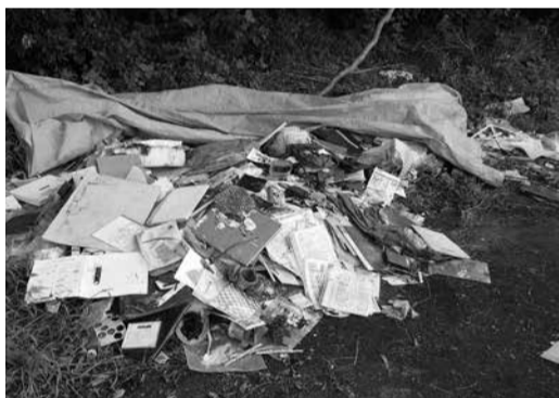
不法投棄されたごみ

不法投棄は犯罪です。不法投棄をした場合、5年以下の懲役、1,000万円以下の罰金（法人は