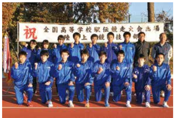
▲師走の都大路での活躍が期待されます

11月2日、旭市で行われた男子県高校駅伝競走大会で八千代松陰高校が2年ぶり7回目の優勝を飾り、全国大会の切符を手に入れました。県大会の3週間後に栃木県で行われた関東高校駅伝競走大会でも、大会新記録で見事優勝。12月22日(日)に京都で行われる全国大会に向け、最終調整をしています。「スタートで良い位置をキープして逃げ切りたい。上位入賞を目指す」と陸上部の福井監督。当日はNHK総合テレビとラジオ第1で放送される予定です。みんなで応援しよう。