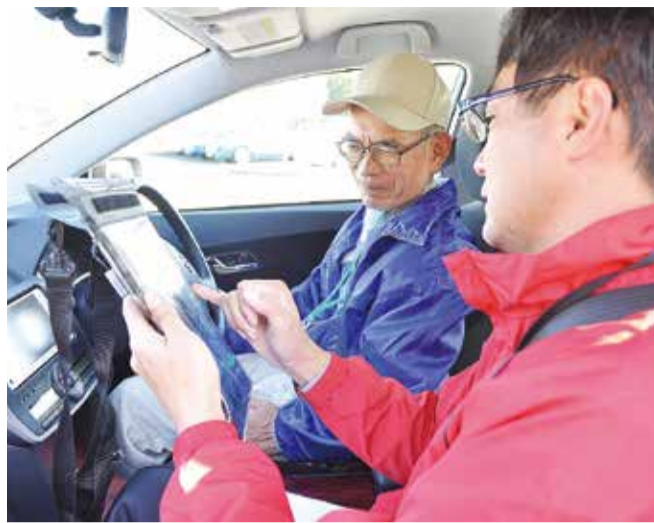
▲車に接続したモニターで燃費を確認。受講者の運転操作を分析します

「自転車を漕いでいる気持ちでアクセル操作を」とインストラクター。自転車なら、目の前の信号が赤だったら早めにスピードを落としますし、上り坂が見えれば手前でペダルを強く漕ぎ出しますよね。車でも先の状況をよく見て無駄を省くことが大切です。