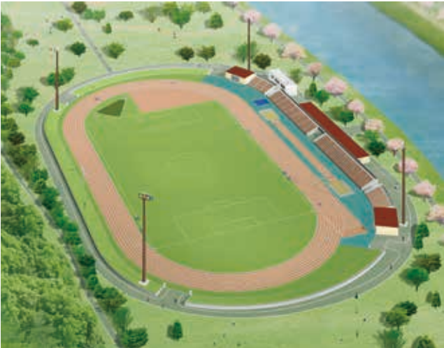
▲第4種公認陸上競技場。トラックの内側は人工芝を使用します