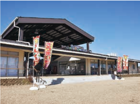
▲25年4月にオープンしたやちよ農業交流センター