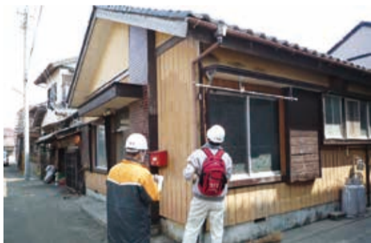
▲震災時の危険度判定の様子

2月26日、市は(一社)千葉県建築士会八千代支部及び(社)千葉県建築士事務所協会八千代支部と「地震災害発生時における応急対策活動に関する協定書」を締結しました。地震災害発生時に、市内の応急危険度判定士が速やかに被災建築物の応急危険度判定などの応急対策活動を行えるよう協力体制を整備します。同判定士は、防災拠点施設や家屋などが倒壊する危険性の判定などを行います。