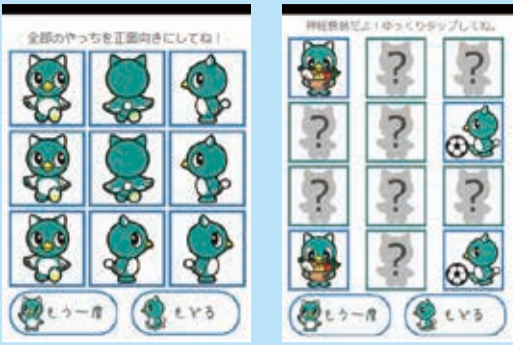
▲こっちむいて! やっち ▲やっちのカードめくり

■やっち関連商品が続々登場、子ども向けアプリも市ホームページ「やっち情報局」では、各事業所や個人で製作されたやっち関連商品を紹介しています。子ども向けのスマートフォンアプリも登場。現在、Android版が無料で公開されています。より身近になったやっちをこれからもよろしくお願いいたします。