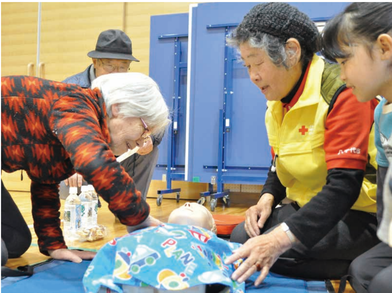
▲赤十字奉仕団のアドバイスに従い、傷病者の意識を確認。胸骨圧迫(心臓マッサージ)を30回と2回の吹き込みを繰り返します

大災害が発生したとき、孫や子どもがけがをして意識がなかったら…。救急車はすぐには来ません。2月22日、勝田台自治会の防災訓練が勝田台中央公園で行われ、300人が参加しました。勝田台地域は孫を持つ高齢者の割合が増加。高齢者も救助の知識を身につけておく必要が出てきました。そこで、初の試みで「じいじとばあばの三世代救急法」を企画。孫や子どもと一緒に、三角巾の使い方やAEDを使った心肺蘇生法を学びました。連続して行う胸骨圧迫は、疲れたら交代するなど、無理のないように行うことが大切です。いつ起きるかわからない大震災。「家族は自分が守る」という意識をしっかりと持ち、日頃から備えておきましょう。