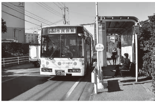
▲試行運行中のコミュニティバス

市街地整備に関する施策では、西八千代北部特定土地区画整理事業に対する事業費の一部負担を引き続き行います。住宅に関する施策では、良好な民間住宅の建設・改善誘導として、民間住宅の耐震化を推進するため、引き続き木造住宅の耐震診断と木造住宅の耐震改修工事に助成します。また、昭和56年以前に建設された市営住宅等の耐震化を進めるため、市営ほしは団地の耐震診断を実施します。