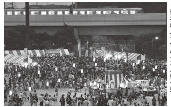
▲昨年の八千代ふるさと親子祭

農業に関する施策では、農業生産基盤の整備と利活用を図るため、将来にわたって保全すべき優良農地を水田再基盤整備事業として整備します。