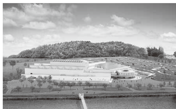
▲27年度オープン予定の中央図書館・市民ギャラリー