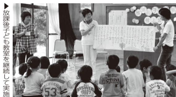
放課後子ども教室を継続して実施