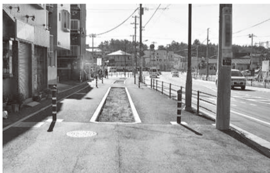
▲整備された大和田駅南地区

公園・緑地に関する施策では、都市公園の整備として、西八千代北部特定土地区画整理地内の北東部近隣公園の整備工事を実施します。また、市街化区域内に残された貴重な緑地を保全するため、八千代台北子供の森の用地の取得を引き続き行います。