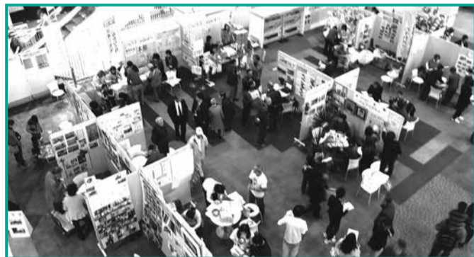
▲団体の活動を紹介する市民活動サポートセンターまつり

今年度の納税通知書等が届かない（納税する必要がない、あるいは支援したい団体の届け出締切日までに通知書が届かない）人でも、25年度分を納税している人は、選択届け出ができます。昨年6月ごろに届いた25年度の納税通