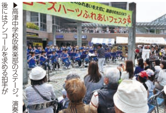
高津中学校吹奏楽部のステージ演奏の様子。後にはアンコールを求める拍手が

5月24日と25日に開催された緑が丘ローズハーツふれあいフェスタに、約5,000人が来場しました。テーマは「市の花バラに感謝、ふれあいの輪で人に感謝、クリーン活動で地元へ感謝」。会場となった八千代緑が丘駅前広場にはフリーマーケットや模擬店が並び、ステージでは19団体が演奏やダンスなどを披露しました。東日本大震災の被災者や昨年の台風26号で水害の被害にあった高津中学校への募金活動も実施。天候にも恵まれ会場は活気付いていました。