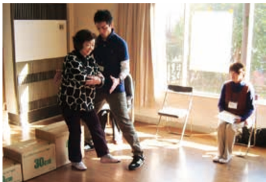
脚力測定 のイメージ

今年度は次の6講座が新たにスタートします。公共施設の在り方に関心がある人や、健康に関心のある人はぜひ活用ください。