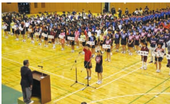
▶各種目の代表のほか、市内11中学校の卓球部員も参加しました