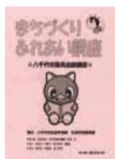
▲26年度のパンフレット

各講座の詳しい内容は、「まちづくりふれあい講座」のパンフレットまたは市HPをご覧ください。パンフレットは生涯学習振興課、公民館、支所などに