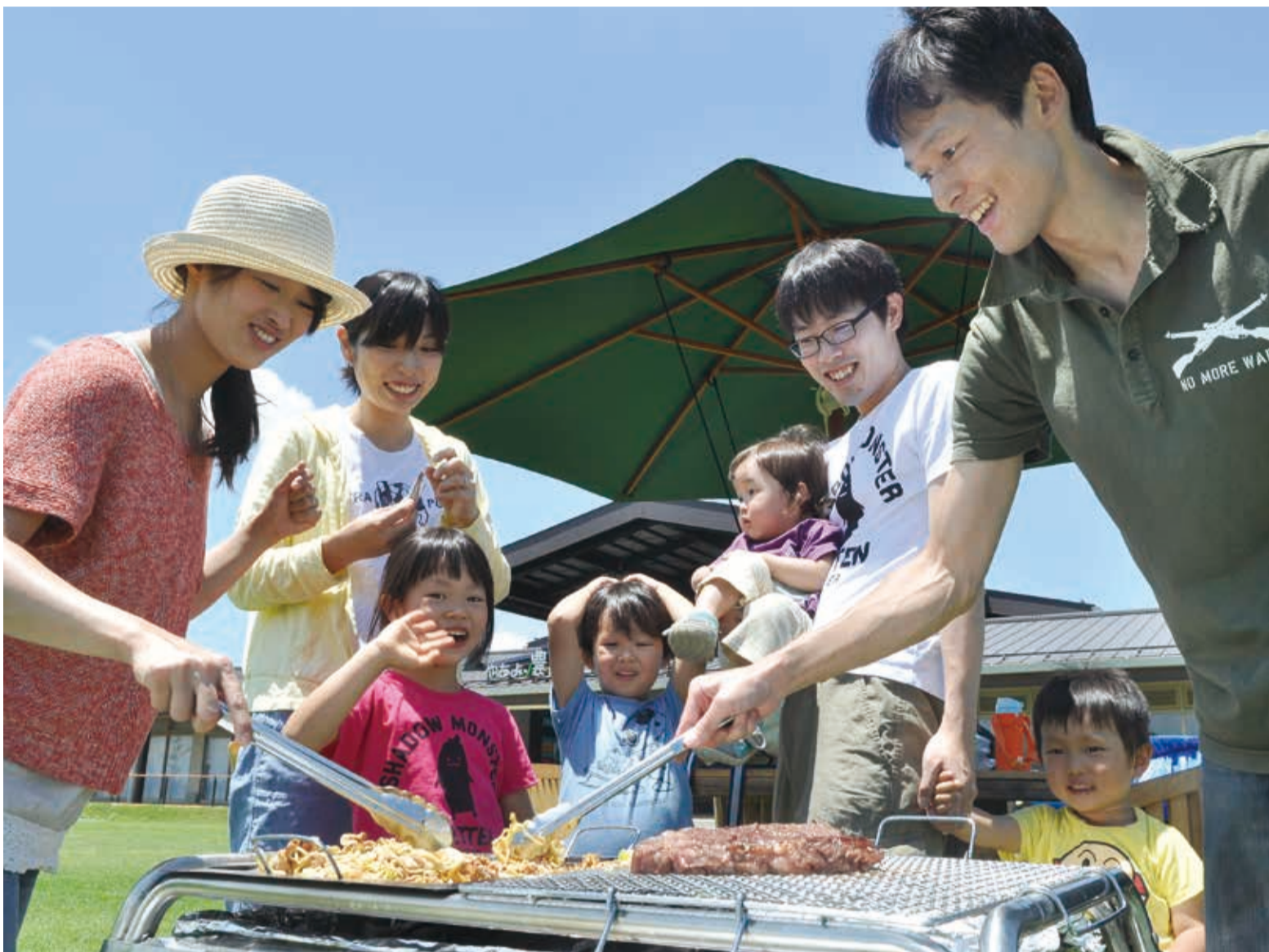
▲「近場で楽しめるのがいいですね」と利用者。芝生の上では無邪気に駆け回る子どもたちの姿も

7月は梅雨が明け、夏の暑さが本格化する時期です。各地で海開きや山開きも行われ、野外活動を楽しむ人も多いのではないのでしょうか。昨年オープンした農業交流センターではアウトドア料理の定番、バーベキューができます。コンロや網、テーブルなどの必要な器材は施設で貸し出し。好きな食材を持ち寄り、食べ終わった後の片付けや洗浄の必要がありません。8月31日(日)までは夏期限定で平日の利用もできます(第2月曜日は休館)。青空の下、開放感のある芝生の上で気軽にバーベキューを楽しんでみませんか。利用方法など詳しくは同センター☎406-4778へお問い合わせを。同センターのホームページもご覧ください。