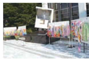
▲展示された千羽鶴は広島・長崎に献納します

原爆犠牲者のご冥福を祈り、恒久平和への誓いを新たにするため、広島市の原爆投下時刻に合わせて、黙とうと献花を行います。同時に、募集した千羽鶴と原爆に関するパネルを展示します。 ▼日時 8月6日(水)午前8時から ▼場所 市民会館平和祈念碑前(雨天時は同館ロビー) (国際推進室)