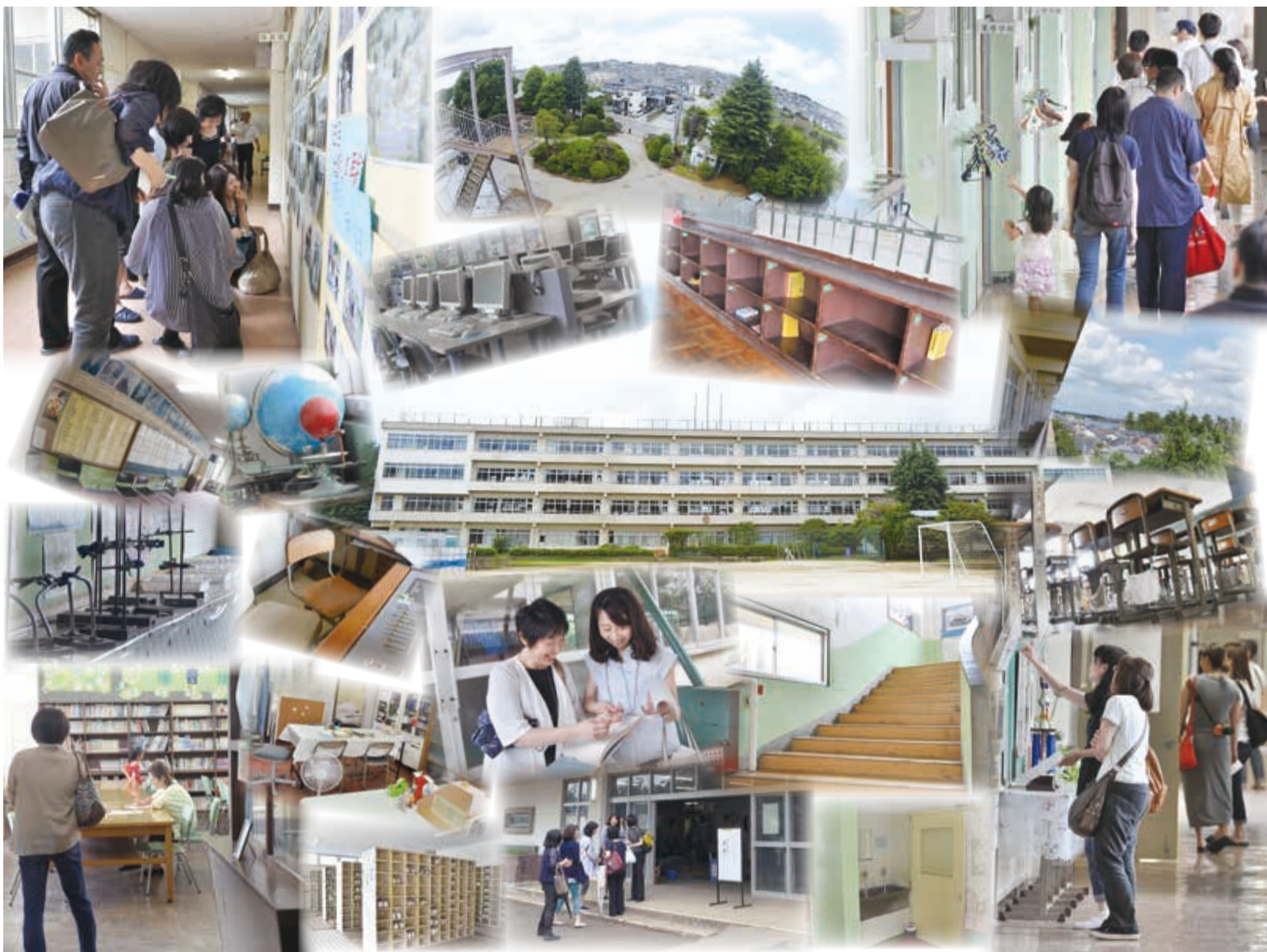
▲内覧会の様子は市ホームページでも紹介。「八千代中内覧会 取材」で検索してください

八千代中学校は昭和22年に開校した歴史のある中学校。40年に現在地に移転して以来、1万2,489人の卒業生を送り出してきましたが、老朽化が進んだことから新校舎への建て替えが行われています。