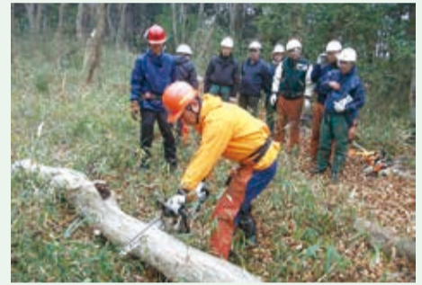
▲里山は人の手が加わることで維持・管理されています

近年、暮らしの変化や都市化などにより谷津・里山は減少。さらに、手入れができずに竹が増え続け、荒廃した里山が見られるようになりました。そこで、市では23年度に「谷津・里山保全計画」を策定。谷津・里山を保全する取り組みの一つとして、里山整備の担い手を育成する「里山整備ボランティア育成講座(里山楽校)」を開催しています。内容は、県内・市内の里山活動の見学や、森についての学習、チェーンソーの扱い方、伐採した竹を利用した竹垣作りなどです。今年度も秋に開講します。自然や谷津・里山に興味がある人はぜひご参加ください。