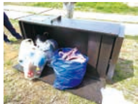
▲不法投棄されたごみ

一緒に捨てられていたごみを手掛かりに個人を特定し、市と警察によりごみを適正に処分するよう指導しました。