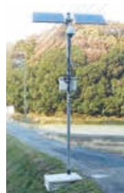
◀高性能なカメラで監視