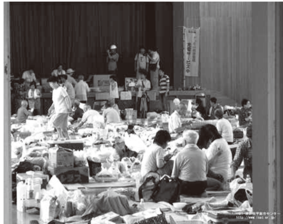
▲避難所の様子。多くの人が集まるため、プライバシーを確保することが難しくなります

東日本大震災時は、市内23か所の避難所を開設し、最大で1,201人を受け入れました。