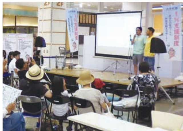
◀6月に行われた1%支援制度のPRイベント。支援対象団体が日頃の活動をPRしました。

団体の事業実施期限は、27年3月31日(火)です。各団体は、事業終了後、市に実績報告書を提出。