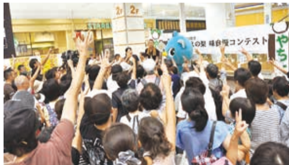
▲じゃんけんの勝者5人にはコンテストで入賞した梨が1箱ずつプレゼントされました