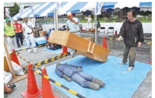
▲転倒防止対策では実演で家具を固定する大切さを学びました

避難。職員の説明を受けながら、避難所で自分たちが何をすべきかを考え、行動しました。訓練後参加者からは、「受け身ではいけない。自分たちが主役なんだと思った」との声があり、避難所運営への意気込みが感じられました。