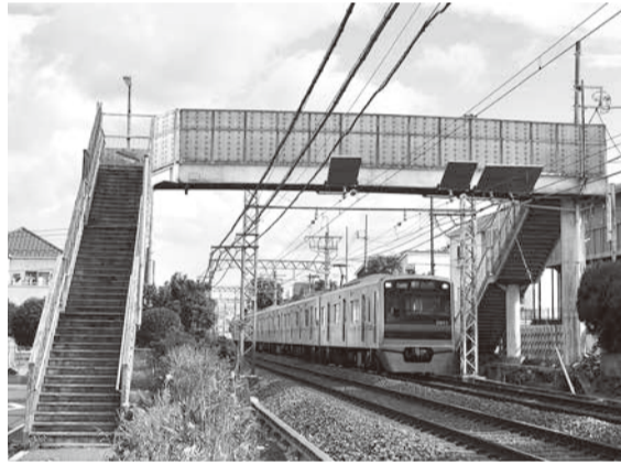
▲八千代台1号跨線歩道橋

■26年度八千代市介護保険事業特別会計補正予算（第1号）歳入歳出それぞれ5,466万7,000円を追加し、総額92億6,933万4,000円。