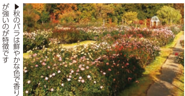
▶秋のバラは鮮やかな色で香りが強いのが特徴です

■ハナコロール 秋バラが咲く庭園前に個性豊かなお店が集まり「マルシェ」(市場)をつくります。▶日時 10月26日(日)午前9時～午後4時