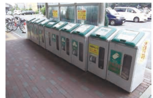
▲スーパーなどに設置されている回収ボックス

ックスを設置し、ペットボトル・紙パック・白色トレイ・植物性食用油を回収しています。