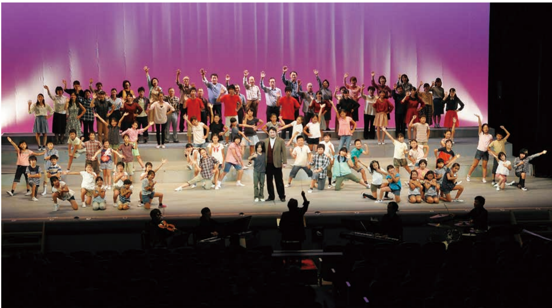
▲「ぞうれっしゃがやってきた」は小学生、八千代少年少女合唱団、八千代市合唱協会、生演奏のコラボレーション。20回を超える練習を重ね、本番を迎えました