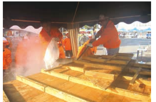
▲源右衛門鍋では最大5,000食を作ることができます

出品します。市内産の食材を使い、直径2mの大鍋「源右衛門鍋」で作られるとん汁。前回まで3回連続で準優勝に輝き、今回は一層優勝への期待が高まります。同グランプリのHPでインターネ