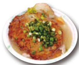
▲もちぶた炙りチャーシューバージョンとん汁

今回も全国から50団体が出場予定。八千代市からは、街づくり市民の会が、源右衛門祭でもおなじみの「もちぶた炙りチャーシューバージョンとん汁」を