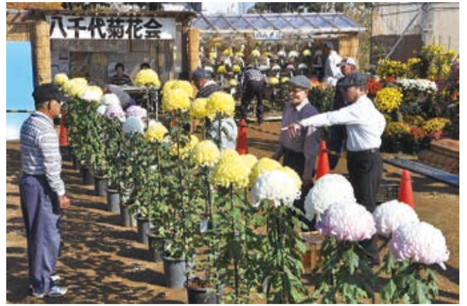
▲11月7日には県知事賞・市長賞を決める審査会が行われました

気高い美しさが特徴の菊。立派な菊を育てるのに高度な技術が求められます。同会では若い世代に