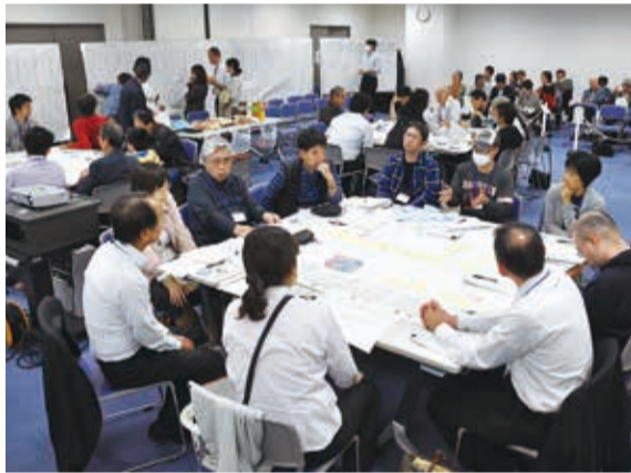
▲3つのグループに分かれて討議

既存の地域図書館4館や来年度開館予定の中央図書館の、運営経費と市民サービスの適切なバランスについて市民の皆さんと検討する「図書館ワークショップ(グループ討議)」を、10月4日・11日・26日に八千代台東南公共センターなどで開催しました。