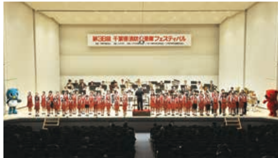
▲八千代市を含む第2グループと八千代少年少女合唱団による「翼をください」でエンディングを締めくくりました

10月25日(土)、第36回千葉県消防音楽隊フェスティバルが市民会館で行われ、約1,300人が来場しました。八千代市消防音楽隊を始め県内14消防音楽隊が、「We Are The World」や今年話題の「Let it Go」などを演奏。八千代少年少女合唱団も特別出演しました。