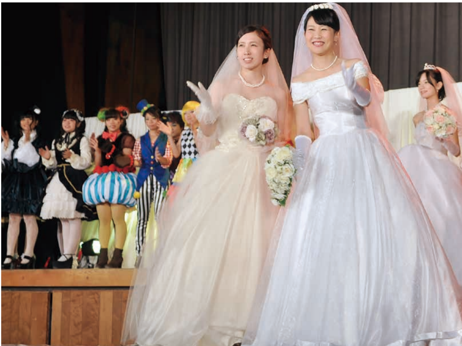
▲3年生総勢38人が華やかな衣装を次々に披露

11月7日、八千代高校で家政科ファッションショーが行われました。今年は「Black Swan(ブラックスワン)」「Formal Dress(フォーマルドレス)」「Wedding Dress(ウエディングドレス)」など6つのテーマに分かれて全3年生38人が自作の衣装を披露しました。