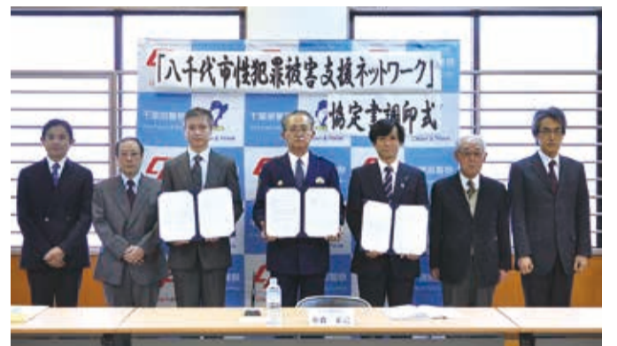
▲関係機関が連携して被害者をサポートします

3機関が連携し、情報を交換することで、性犯罪被害者への法的支援と精神的ケアを一体的に行うことを目指すもので、県内では初めての試みになります。