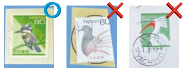
▲目打ちまで切られているものやあらかじめ印刷されているものは回収していません