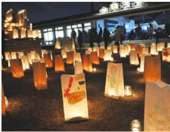
◆八千代のキャンドルナイトを開催 12月23日、農業交流センターで「八千代のキャンドルナイト」が行われました。約2,100本のキャンドルがふれあい広場を埋め尽くし、訪れた人たちは、普段とは趣の違う幻想的な光景を楽しみました。