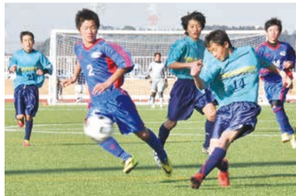
▲総合グラウンドで行われた八千代市選抜A(緑色ユニフォーム)といわきトレンジャーU-14のゲーム

優勝…船橋市中体連選抜U-14 準優勝…松戸市立第三中学校 3位…東京朝鮮中学校選抜