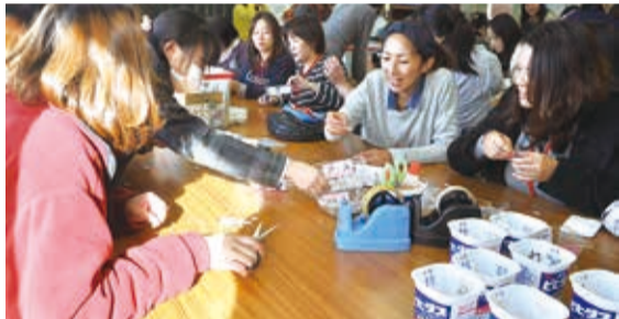
▲月1回、仕分けや点数計算などを行っています

また、購入費の10パーセントは、へき地の学校や災害被災校、開発途上国などの子どもたちの支援に使われます。基本的に学校単位での参加のため、個人では点数を集めても備品購入はできませんが、地域の子供たちへの応援という形で参加することができます。