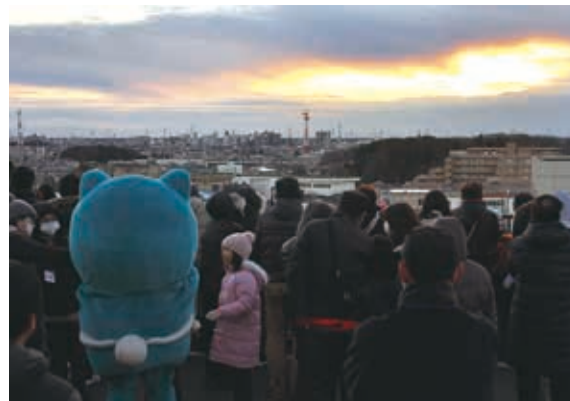
◆市役所屋上で初日の出鑑賞会を開催 1月1日、初日の出鑑賞会を市役所庁舎屋上で開催。155人が参加し、初日の出や富士山など普段見ることのできない屋上からの景色を楽しみました。