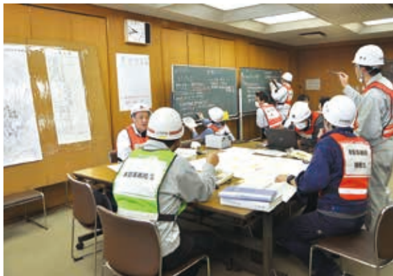
◆市が防災訓練を実施 1月16日、市は防災訓練を実施しました。大規模災害が発生したときに備え、職員は災害対策本部の設置や運営についての手順を再確認しました。