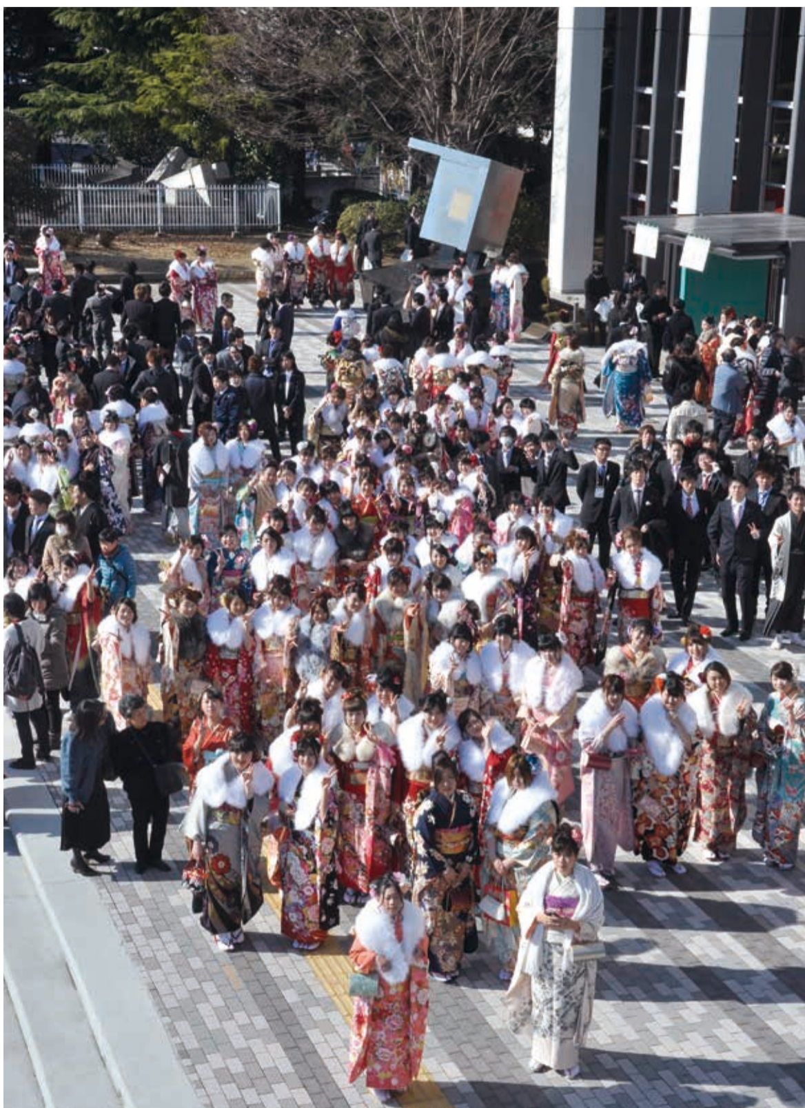
▲新成人が集まり、会場は華やいた雰囲気。※成人式の様子は「やちよNAV i」で放送中。案内は8ページに掲載

今年の八千代市の新成人は1837人。1月11日、市民会館で成人式が行われ、スーツや色鮮やかな振り袖に身を包んだ新成人1292人が出席しました。これまで八千代市の成人式は、1月の第2月曜日「成人の日」に行われていましたが、今回は前日の日曜日に開催。会場では新成人の応援にと、八千代商工会議所からグルメクーポンが配布されました。また、東葉高速鉄道各駅では800円で1日乗り降りが自由になる乗車券が販売されました。 「明日は休みなので、今日は遅くまでみんなと過ごしたい」と新成人。会場は、クラスメイトとの再会を喜びあう声と笑顔に包まれました。