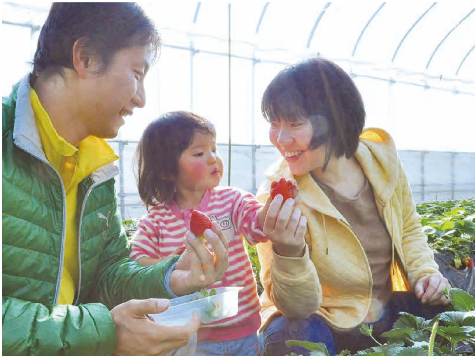
▲「いちご大好き」と手を伸ばす女の子。ここ島田いちご園では、「章姫」と「やよいひめ」の2品種を30分間食べ放題で楽しめます

ビニールハウスの中は、ポカポカと春のような陽気。一步足を踏み入ると甘酸っぱい香りが一面に広がっています。「わあー、いちごがいっぱいだ」と、大はしゃぎで駆け寄る子どもたち。真っ赤に熟したいちごを夢中になって頬張り「20個も食べちゃった」とにっこり笑顔を見せました。