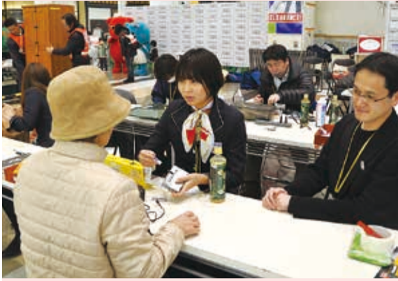
▲いざという時のために、日頃からラジオの点検を