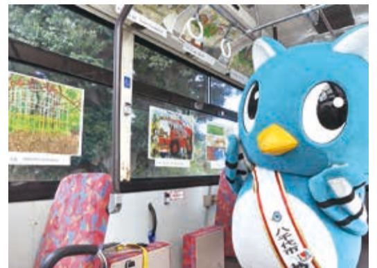
■コミュニティバスで八千代台東小学校絵画展

1月24日と25日、市民会館で第50回関東高等学校演劇研究大会を開催。東京都、神奈川県、千葉県、茨城県、静岡県、山梨県からの代表13校が参加し、熱い演技を披露しました。(写真は最優秀に輝いた千葉県立松戸高等学校の演技)