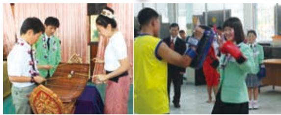
小学校では伝統楽器の演奏や国技のムエタイを体験