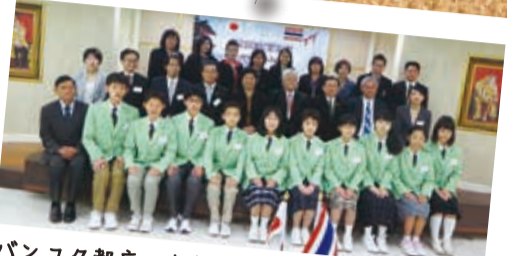
バンコク都庁へ表敬訪問。副知事や職員の方々と

国際平和作文コンクールの入選者から選ばれた、小学生6人と中学生4人の八千代子ども親善大使一行が、1月21日～28日の日程で、友好都市タイ王国バンコク都を訪れました。バンコク都庁訪問やプラーヤーモン小学校での文化体験、3泊4日のホームステイなどを通して現地の人々との交流を深めました。(指導課)