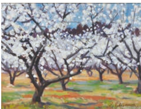
▲「勝田の梅林」(海老沢巖夫)