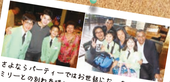
さよならパーティーではお世話になったホストファミリーとの別れを惜しみ、再会を約束しました