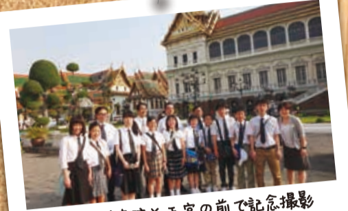
エメラルド寺院と王宮の前で記念撮影