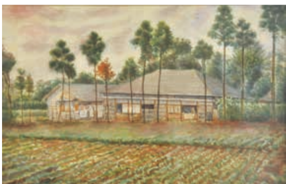
▲「北総の上層農家」(浅井忠)