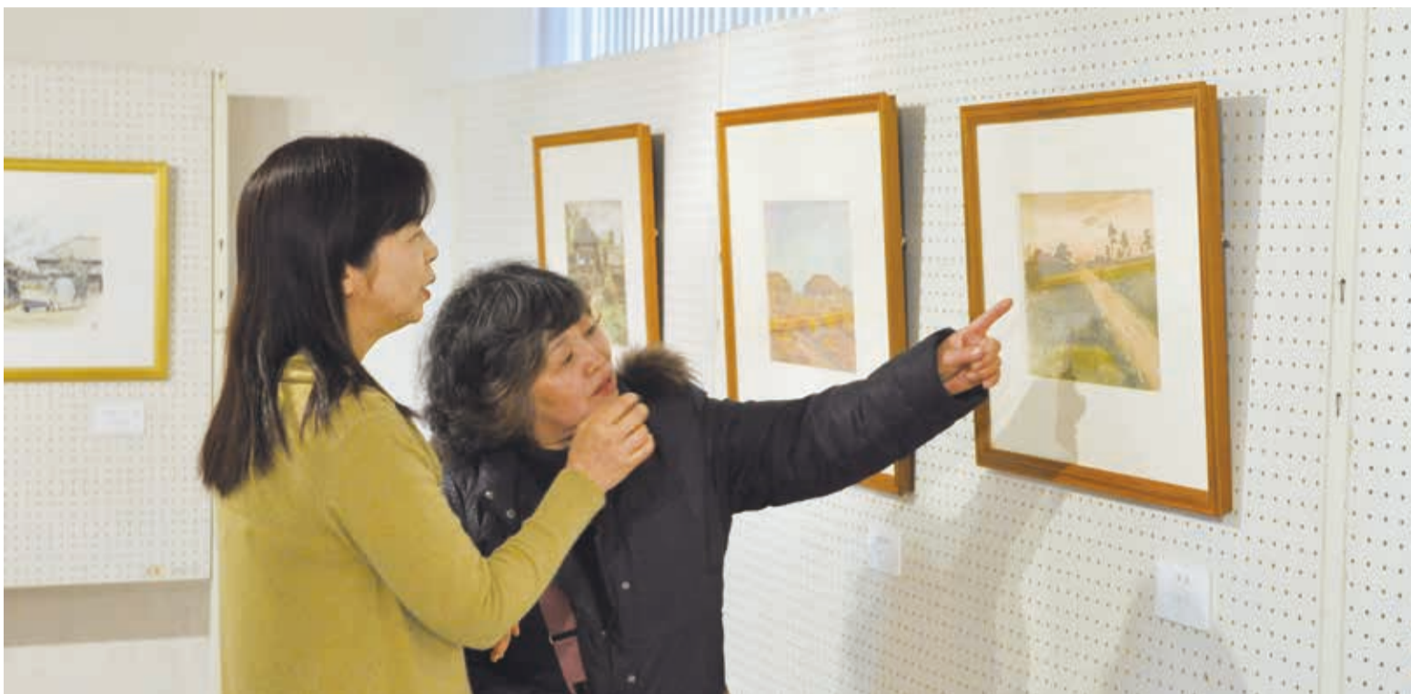
▲「ちょっとした筆の使い方が素敵なんですよね」と熱心に鑑賞する来場者も