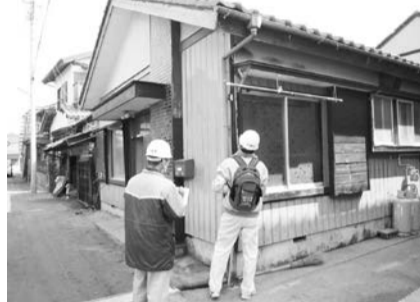
▲木造住宅耐震診断の様子