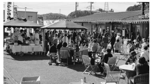
▲昨年行われたふるさとステーションと農業交流センターの合同収穫祭