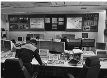
▲高機能消防指令センター