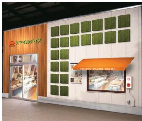
▲スマイルデイズ ファームズキッチン店のパース図

▼営業時間 午前9時30分～午後6時30分 ▼定休日 木曜日、第2月曜日(いずれも祝日の場合は営業) ▼問い合わせ 農業交流センター ☎(406)4778へ。 詳しくは、同センター ホームページをご覧ください (農政課)