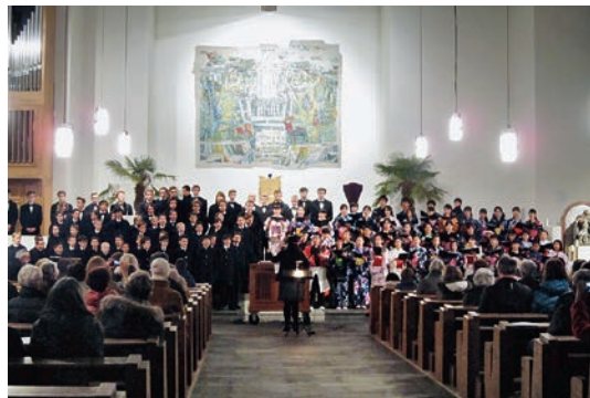
▲インスブルック市のアラールハイリゲン教会での合同コンサート