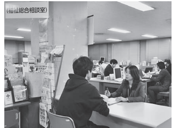
▲生活困窮者自立支援事業を行う福祉総合相談室

◆保育園運営事業(陸北保育園の耐震改修に係る実施設計)…385万円 耐震診断結果に基づき、陸北保育園の耐震補強に係る実施設計を行います。