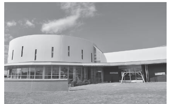
▲7月オープン予定の中央図書館・市民ギャラリー