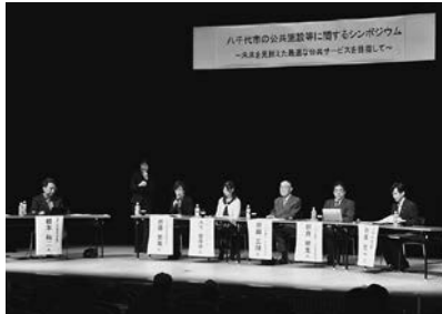
▲公共施設マネジメント事業として昨年はシンポジウムを開催