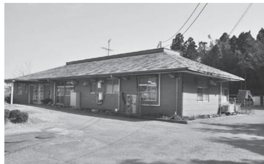
▲陸北保育園は28年度に耐震補強工事を予定

◆子ども企画事業(子育て短期支援(ショートステイ)事業)…92万円 保護者の疾病等の理由により家庭において養育を受けることが一時的に困難となった児童について、児童養護施設等において宿泊を伴う一時預りを実施します。