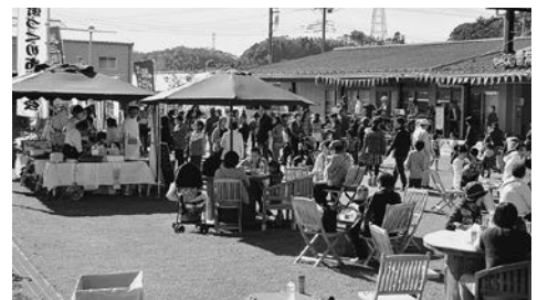
▲昨年行われたふるさとステーションと農業交流センターの合同収穫祭