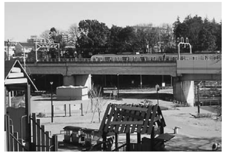
▲東葉高速鉄道は高架橋柱の耐震工事を行います