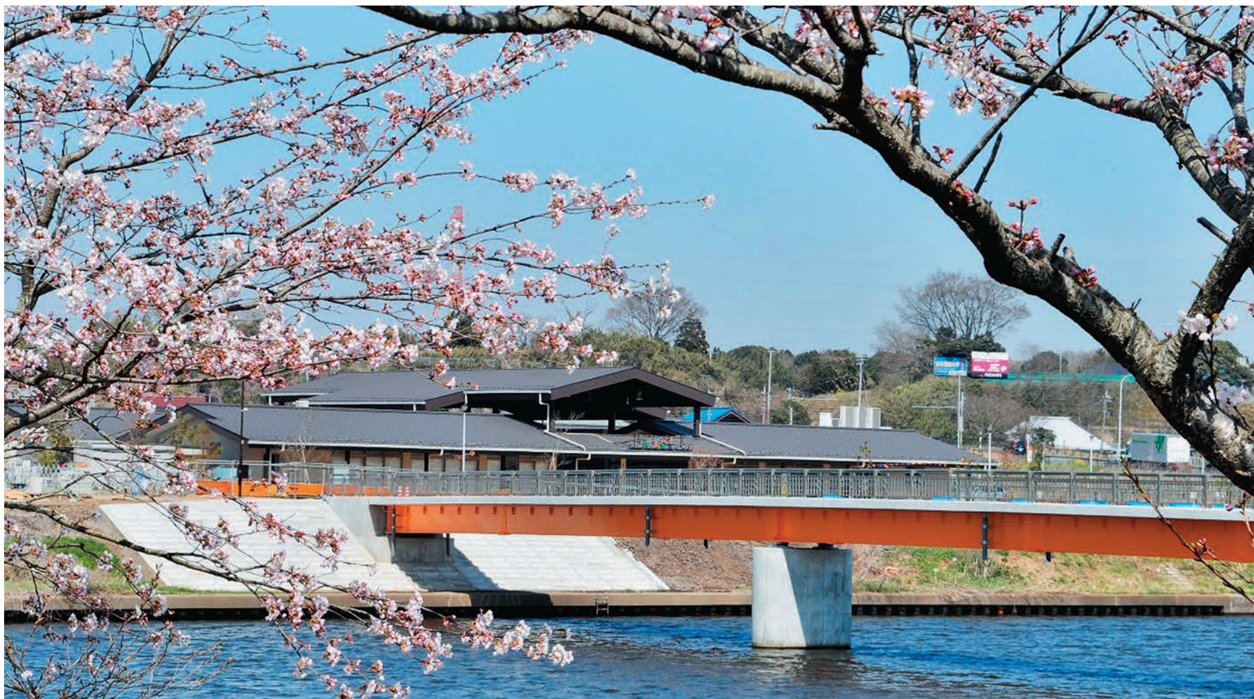
▲開通間近の歩道橋（ペDESTリアンデッキ）とやちよ農業交流センター