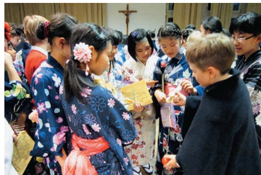
▲けん玉やお手玉、折り紙など日本の遊びを紹介