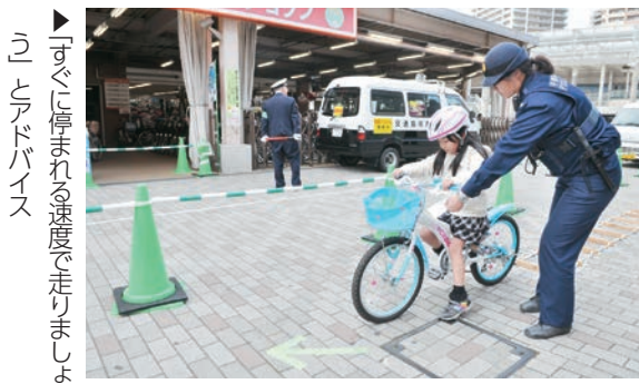
▶すぐに止まれる速度で走りましょう

3月21日、イオンモール八千代緑が丘で「ルールを守ろう!! 自転車安全教室」が行われました。開店10周年を記念して企画されたもので、近隣の小学生や買い物に訪れた親子などが参加。警察官や交通指導員が、スラローム体験や自転車シミュレーター体験などを通して安全な乗り方を指導しました。スクランブル交差点が多く、自転車と歩行者の事故が増加している緑が丘地区。歩行者が多い場合など、危険な状況では自転車を下りて、押して歩きましょう。