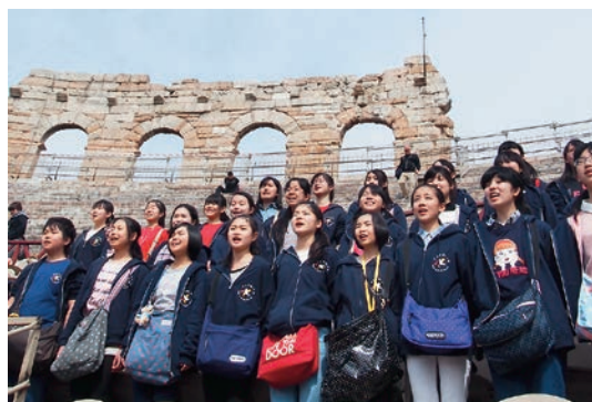
▲イタリア・ヴェローナの野外歌劇場では、イタリア政府観光局からの要請で急遽ライブ演奏を実施