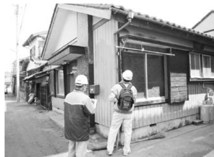
▲木造住宅耐震診断の様子