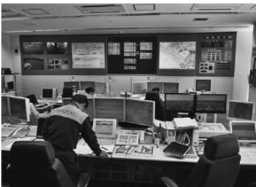
▲高機能消防指令センター