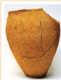
下総国印旛郡村神郷 丈部 刀自呼召代進上 延暦十年十月廿二日

市指定文化財8点を含む墨書土器11点に加え、人面刻書土器、鉄製鋤先、土器片を転用した硯など上谷遺跡から出土した17点が出展されます。