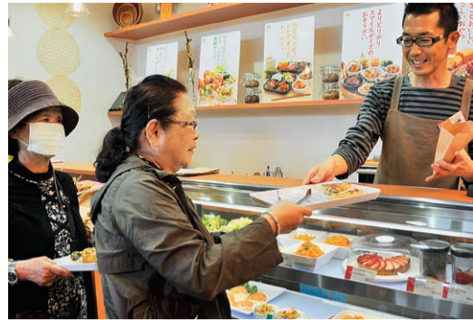
▲「お惣菜がいっぱいあって選ぶのが楽しいですね」とスマイルデイズ道の駅やちよ店を訪れた買い物客