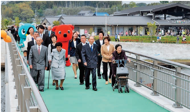
▲ひ孫を含め4世代16人が先頭となり行われた渡り初め