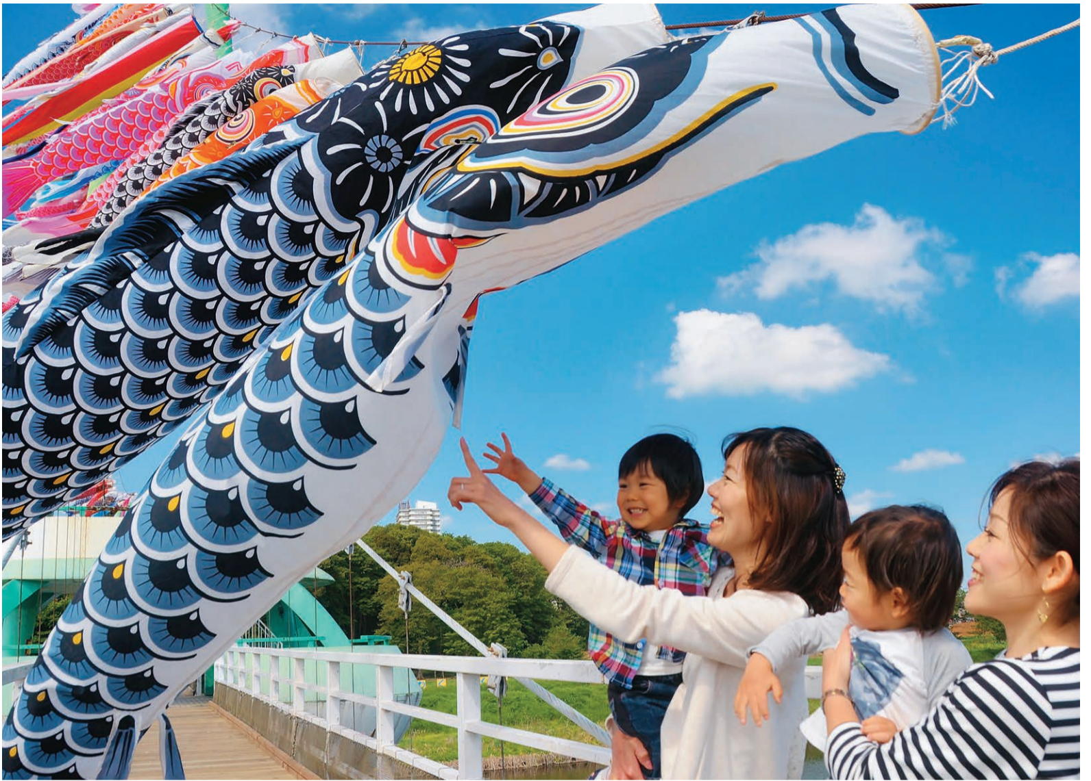
▲「わあー大きいなあ」と間近に見るたくさんのこいのぼりに大興奮。こいのぼりを触ろうと大はしゃぎで手を伸ばしました

八千代ふるさと親子祭実行委員会が主催する「こいのぼり大遊泳」が4月29日～5月6日に行われました。子どもたちの健やかな成長を願い、昭和63年から行っているもので、今では新川沿いの春の風物詩となっています。初日の朝8時、ゆらゆら橋前に集合したのは、市少年野球連盟のメンバー約40人。市民から寄贈されたこいのぼりを1匹1匹丁寧に結びつけ、9時を回る頃には100匹を超える色とりどりのこいのぼりと新川名物「うなぎのぼり」3匹が大空を優雅に泳ぎました。多くの家族連れでにぎわうなか、初節句を迎える親子の姿も。「このこいのぼりのように元気いっぱい育てほしい」とわが子の成長を願いました。