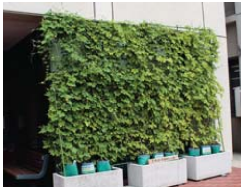
▶市庁舎前のグリーンカーテン

部屋を涼しくし、エアコンの電気使用量の削減もできるグリーンカーテンは、家計にやさしく、手軽にできる省エネルギー行動です。また、ゴーヤなどは、果実も収穫できるので、夏を楽しく、涼しく過ごす工夫のひとつです。※10月中旬、グリーンカーテン写真展を実施する予定です。グリーンカーテンを作り、力作を写真展に応募してみませんか。