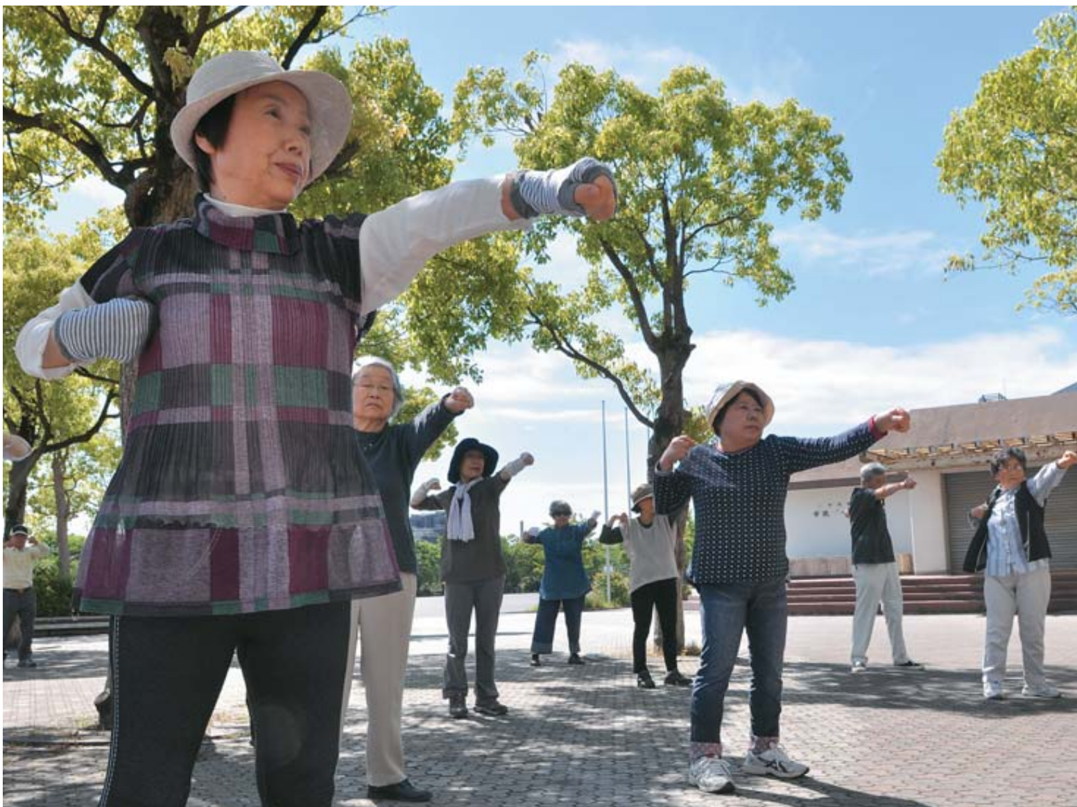
▲月2回行っている「お試し体操広場」。元気体操以外にも歌に合わせた体操や下半身の筋肉トレーニングなども行い、全身をバランスよく動かします

「最近筋力が落ちてきた」「少し歩くだけで息切れする」といった経験、あなたにもありませんか。そんな人には「やちよ元気体操」がおすすめです。高齢者の転倒予防を目的に作られた市オリジナルの体操で、「いつでも・どこでも・だれでも」できることが特徴。体操は2種類あり、上級編は雑誌「Tarzan」のご当地体操グランプリで、リフレッシュ賞を受賞しました。「始めたいけれど、一人だとちょっと…」という人には、この「お試し体操広場」。初めてでも仲間が温かく迎えてくれ、楽しく体を動かすうちに顔なじみも増えます。6月は10日(水)・24日(水)の午前9時～9時30分に総合運動公園噴水広場で開催(雨天中止)。現地集合です。飲み物をお持ちください。