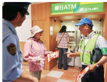
銀行やATM周辺で注意を呼びかけました

詐欺事件は、融資や架空請求など、手を変え、品を変えて行われ、市内の昨年の被害額は約1億円に。6月15日、緑が丘、八千代台地区などの駅周辺で、八千代警察署員と八千代市防犯組合連合会の指導員がチラシを配り、注意を呼びかけました。詐欺の件数が前年の2倍に増えたという警察官や指導員の話をきいて、「自分は大丈夫という考えを改めたい」と足をとめた人は話していました。自分が被害者にならないように、家族で電話での合い言葉を決めるなど詐欺に遭わない工夫について、考える機会を持ちましょう。