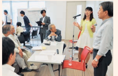
▲「文化・芸術に関するパネルディスカッション」のプレーストリーミング