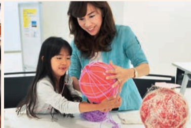
▲「工作バルーンコーナー」