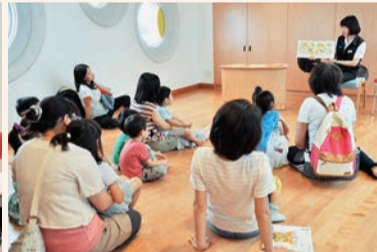
▲おはなしの会「七々と図書館の誕生会」