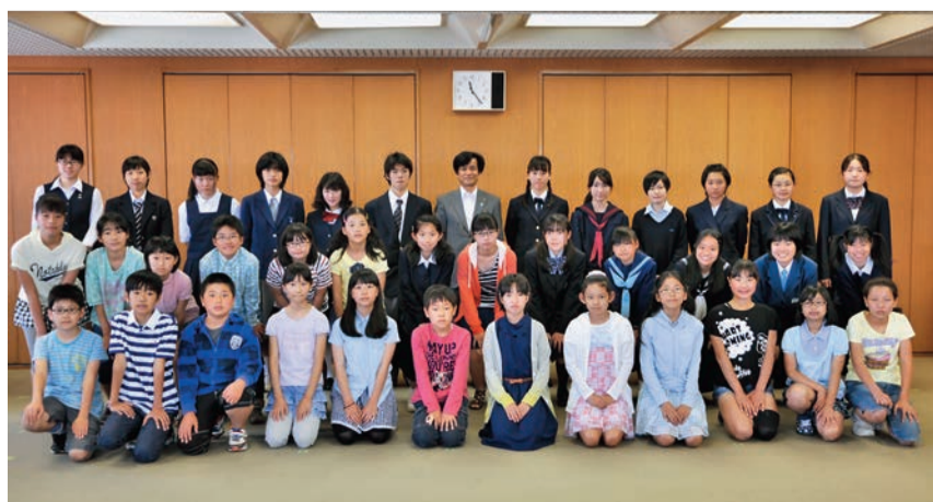
5月10日に市役所で委嘱式が開催されました

市内の小・中・高校の推薦で、27年度の広報青少年版記者41人が選ばれました。特集テーマに沿った自分の考え、学校での出来事や話題、新聞やニュースで気になることを報告。今年度は、今号、28年1月1日号、3月15日号に掲載します。