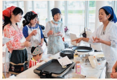
▲「八千代の食を考える」

中央図書館・市民ギャラリーが7月1日にオープン。当日はテープカットなど記念式典が行われました。また、7月1日～5日は多くのイベントが開催され、延べ1万6,890人が来場しました。