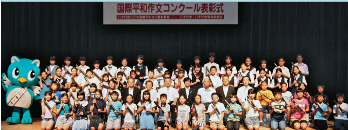
◀ 7月8日に表彰式が行われました

入選作品をまとめた作文集「君たちを忘れない」第27集は、28年3月頃から市内の図書館で閲覧できます。また、入選者の中から選ばれた八千代こども親善大使10人(*印がついた児童・生徒)が、友好都市バンコク都を訪れます。