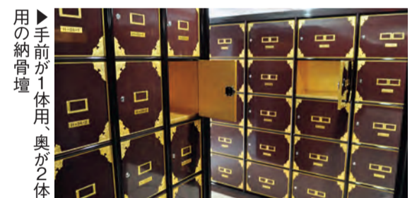
用 ▶ 手前が1体用、奥が2体用の納骨壇