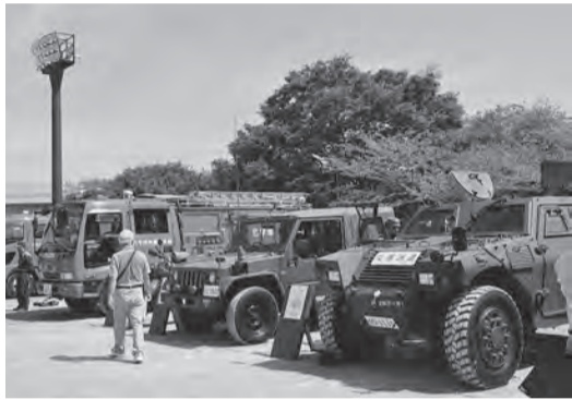
▲自衛隊の車両展示

消防・警察・自衛隊による関係車両の展示や、はしご車先端バスケットへの搭乗体験を実施します。