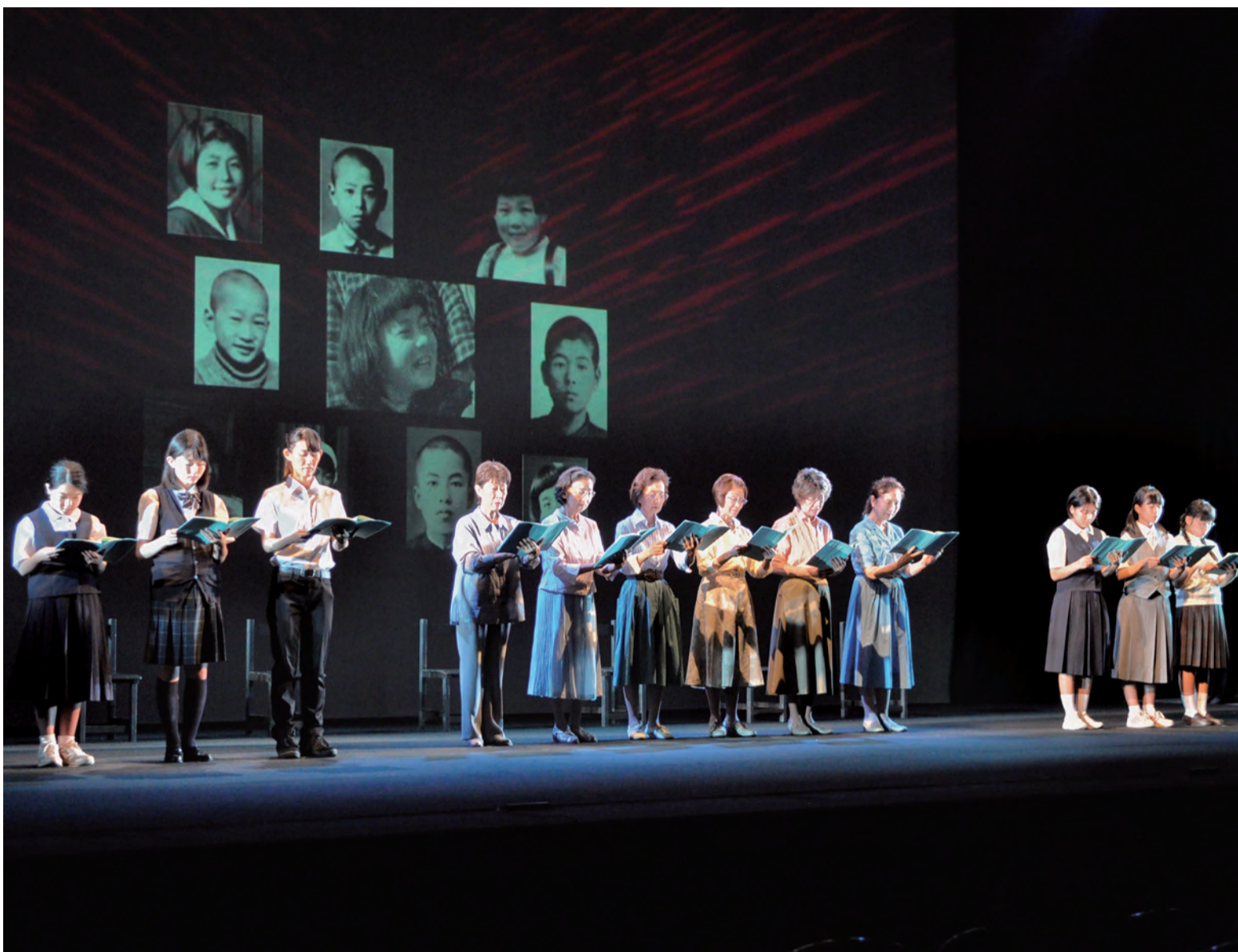
▲被爆地の光景や被爆者の写真が浮かび上がる中、女優6人と一般公募で参加した市内在住の中学生・高校生と一緒に朗読しました

昭和20年の終戦から70年。市内で戦争を体験していない人は8割を超え、戦争の事実が風化しつつあります。戦争という過ちを繰り返さないためには、過去に目を向け、戦争の悲惨さと平和の尊さを次の世代へと語り継ぐことが大切です。