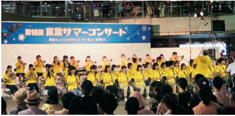
◀ 昨年の千葉英和高校吹奏楽部の演奏

8月27日(木)・28日(金)に八千代緑が丘駅の南側駅前広場で、「第19回東葉サマーコンサート～すてきなリズムの定期便～」を開催します。東葉高速線沿線の中学校・高校の吹奏楽部などによる演奏会で、今回は過去最多となる11校12団体が出演します。お問い合わせは、東葉高速鉄道(株)企画課 ☎458-0017へ。※演奏時間は変更になる場合もあります。雨天中止。