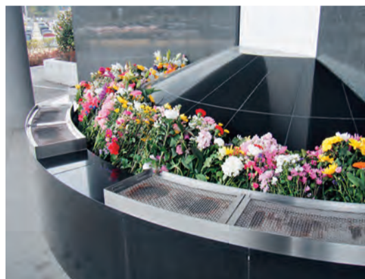
参拝広場の献花台