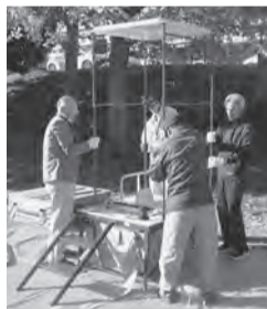
▲仮設トイレを協力して組み立てます

今年度は各地域で次の日程で自主防災組織を中心に防災訓練を行います。昨年度は、心肺蘇生法や、応急手当訓練、消火訓練、煙中避難体験などを行いました。今年度も災害時に役に立つ訓練を中心に行う予定です。「自分たちの地域は自分たちで守る」という意識を持って、お住まいの地域で訓練が行われるときは積極的に参加を。喉元過ぎれば熱さを忘れないように家族一緒に参加してください。