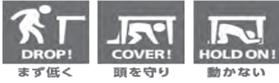
▲シェイクアウトの手順

やちよ防災情報メールなどにより、地震発生時の危険回避行動を各地で一斉に行う訓練です。 ①ドロップ(まず低く)、②カバー(頭を守り)、③ホールド・オン(動かない)の3つの安全行動を行います。やちよ情報メールの登録方法は2ページ右側をご覧ください。