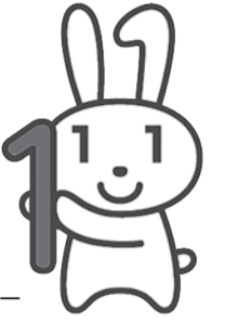
マイナンバーキャラクター「マイナちゃん」

マイナンバー制度は、今まで1人に対して自治体や年金事務所などの各行政機関で持っていた独自の番号を統一して、1人1つの番号(マイナンバー)にし、行政手続きをよりスムーズに、公平・公正に行えるようにする制度です。マイナンバー(個人番号)は、10月から順次郵送で通知され、28年1月から利用を開始します。