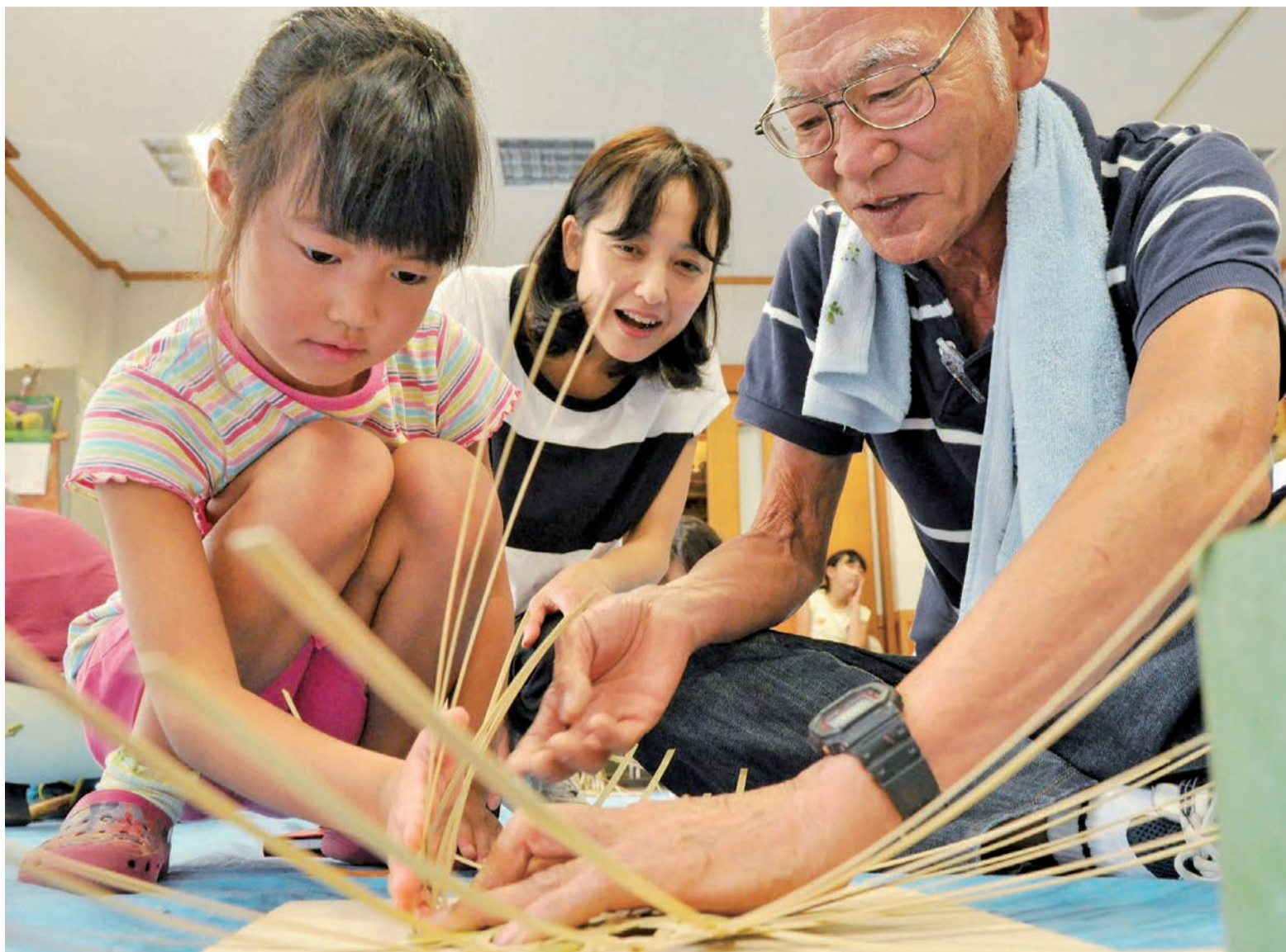
▲八千代竹細工同好会のメンバーに竹の立ち上げ方を教わりました。完成間近の竹かごにお母さんもわくわくしながら見守っています

竹は、国内に約600種、世界では約1,200種もあると言われ、昔から農業・漁業の収穫物を入れたり、食器としても利用されたりと、人々の暮らしに欠かせないものでした。8月1日、子どもたちに竹を使った伝承文化を体験してもらおうと、文化伝承館で竹かごづくりが行われ、親子11組が参加しました。八千代竹細工同好会のメンバーがマンツーマンで指導を行い、「マダケ(真竹)」を細かく裂き、六つ目編みという編み方で、切り花を活ける竹かごを作りました。同館では、水鉄砲づくり、凧づくり、昔遊びなどの伝承文化や、茶道・日本舞踊・邦楽の伝統文化の講座も開催しています。皆さんもお子さんと一緒に参加してみませんか。