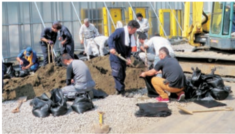
▲土嚢を作る管工事協同組合の皆さん

ありがとうございました 台風や大雨の備えとして、八千代市管工事協同組合様から、土嚢2,000袋の寄附をいただきました。