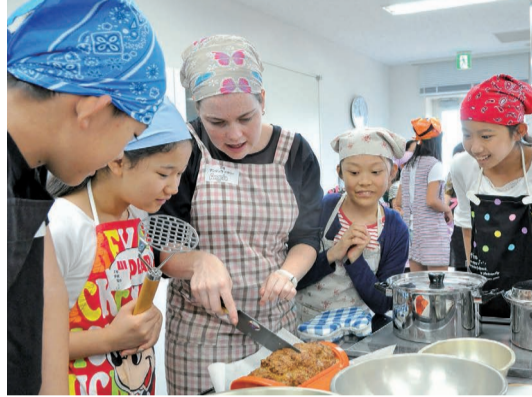
▶焼き上がったミートローフを切るALT。あふれ出る肉汁を見るとみんな笑顔に