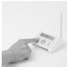
迷惑電話チェッカー

犯人と直接話さないことが大切です。留守番電話機能を使いましょう。録音されると声が証拠として残るため、犯人は留守番電話を嫌います。また、怪しい電話を見分ける自信がないという人は、「迷惑電話チェッカー」を使いましょう。「迷惑電話チェッカー」は自宅の固定電話に接続すると、「電話de詐欺」や、悪質な勧誘電話からの着信を、ランプの色と音声案内で警告してくれます。生活安全課では、「迷惑電話チェッカー」をお試し期間として28年3月31日まで、無料で貸し出しています。詳しくは同課までお問い合わせください。