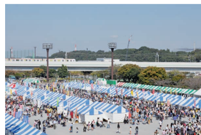
▲昨年は約11万人が来場し、盛り上がりました

市内の商工業や農業の紹介を目的に、約80団体が出展。製品や商品の即売と団体の活動紹介をします。会場では、源右衛門鍋で作るとん汁の販売、模擬店、野だて、ゲームなどが行われます。ステージでは、キャラクターショーやデモンストレーション、ビンゴ、お楽しみイベントなども。