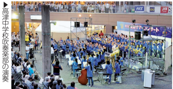
▶高津中学校吹奏楽部の演奏

東葉高速鉄道株式会社主催の東葉サマーコンサートが8月27日、八千代緑が丘駅南側広場で開催されました。高津中学校や八千代東高校など沿線の中学・高校が、軽音楽、吹奏楽を披露しました。