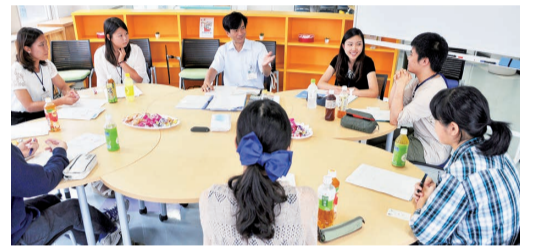
▲市外に住む学生からは、地元と八千代市の違いからさまざまな提案が出されました