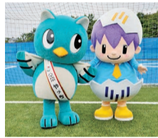
▲東京成徳大学キャラクタ「とっくん」とやっち

市では、「八千代市第4次総合計画後期基本計画」や「八千代市版総合戦略」を27年度中に策定します。その策定にあたり、8月27日、東京成徳大学の学生8人と市長が意見交換会を行い、若い世代の意見を聞きました。