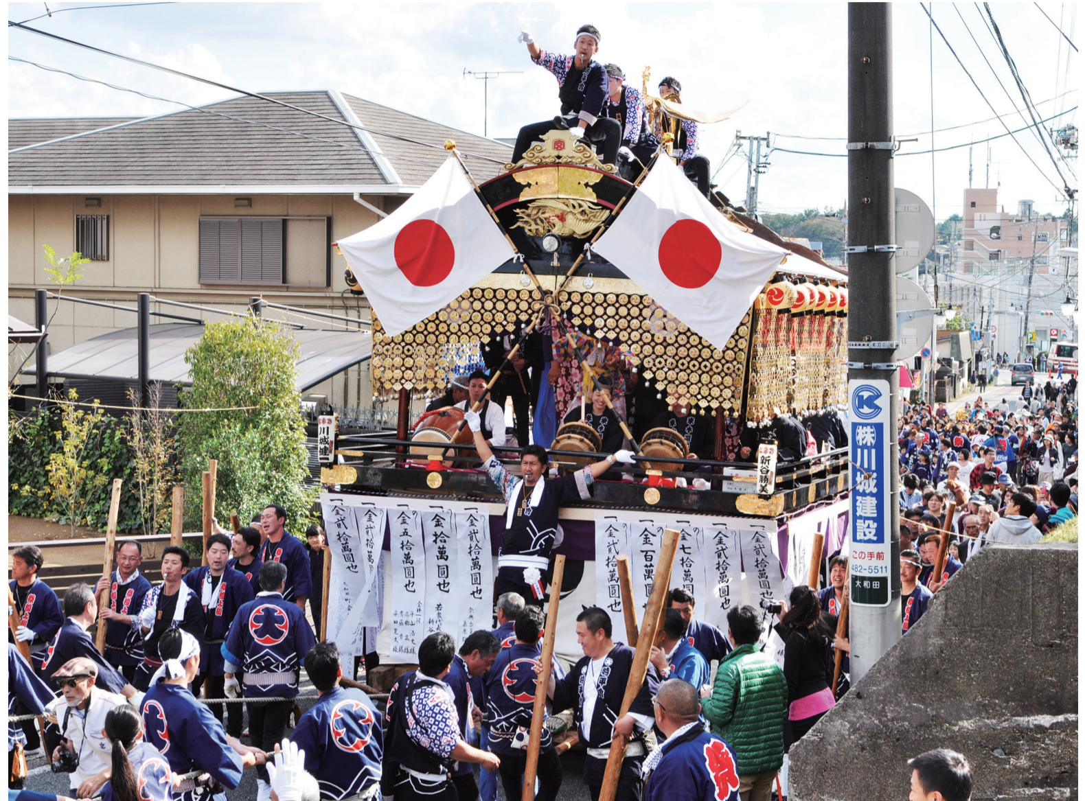
▲11月3日に行われた時平神社の「花流し」。豪華な山車を一目見ようと、沿道は大勢の観客で埋め尽くされました

室町時代に始まったと言われ、安産祈願と安産御礼のために6年に一度開かれる、県指定無形民俗文化財の「下総三山の七年祭り」。丑と未の年に行われ、数えて7年ごとになることからこのように呼ばれ、船橋・習志野・千葉・八千代の4市9神社の神輿が集結します。八千代からは、時平神社(大和田・萱田町)と高津比咩神社(高津)が参加。11月3日には、船橋市の二宮神社で昇殿参拝を終えた神輿と山車が地元に戻って練り歩く時平神社の「花流し」が行われました。多くの見物客で埋め尽くされた成田街道一帯では、氏子たちが威勢の良い掛け声を上げながら激しく神輿を揺らし、沿道は熱気に包まれました。※8ページでも紹介しています。