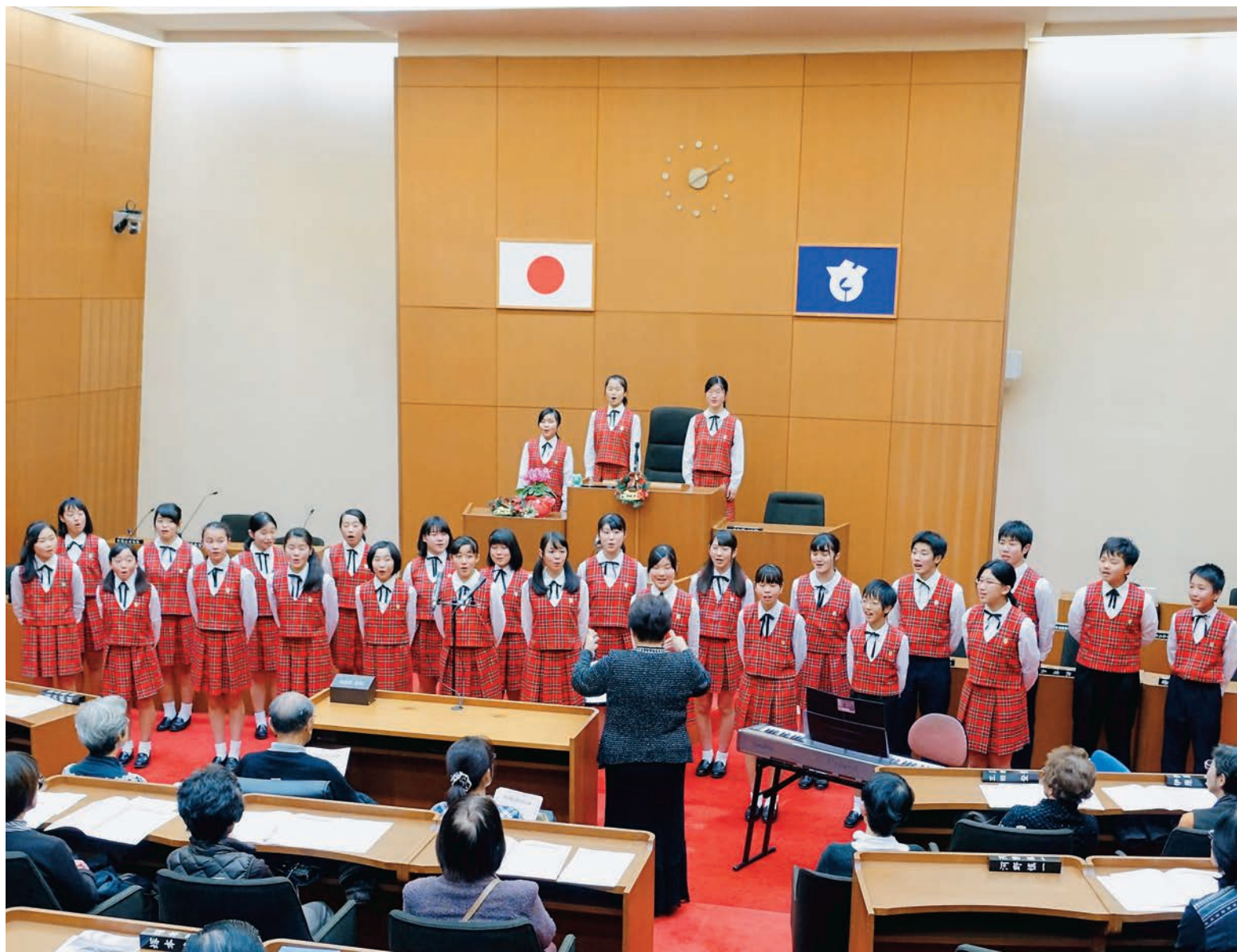
▲歌声を披露する八千代少年少女合唱団。昨年はウィーン、インスブルック、ミラノの演奏旅行を実施しました

市議会をもっと身近に感じてほしいとの思いから、12月19日、八千代市議会本会議場で初のコンサートが開催されました。傍聴席だけでなく議員席も開放され、1部・2部合わせて180人の市民が来場しました。