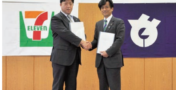
八千代市とセブン-イレブン・ジャパンとの「災害時の物資供給及び店舗営業の継続又は早期再開に関する協定」締結式

◆セブン-イレブン・ジャパンと災害時協定を締結 市とセブン-イレブン・ジャパンは、「災害時の物資供給及び店舗営業の継続又は早期再開に関する協定」を結び、12月14日に締結式を行いました。これは、災害時に、飲料品・食料品や日用品などの物資を安定供給するために、配送車の通行を支援したり、市からの防災・災害情報を市内のコンビニエンスストアを通じて発信したりするものです。