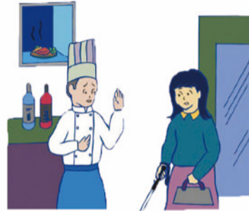
保護者や介助者が一緒にいないとお店に入れない