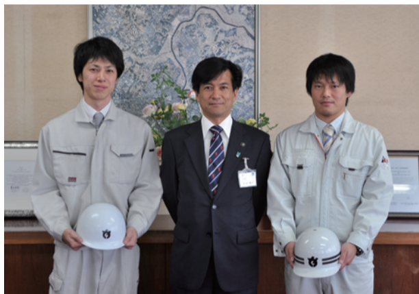
▲4月26日~28日に現地で判定業務に当たりました

県と県内20市は、被災した建物を調査し、二次災害を防ぐため、「応急危険度判定士」の資格を持つ職員44人を派遣しました。