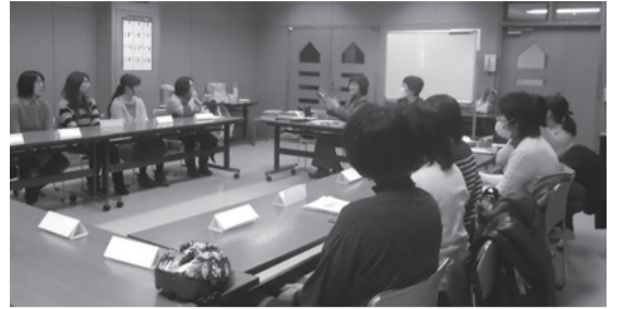
▲「今どきの中学生」をテーマに話し合いました

悩みや迷いは子育てにつきもの。各公民館では、幼稚園児から中学生の保護者を対象に、保護者同士の情報交換や思春期のお子さんとの関わり方など、仲間と一緒に楽しく学べる講座を予定しています。詳しい内容や日程は以下のとおりです。