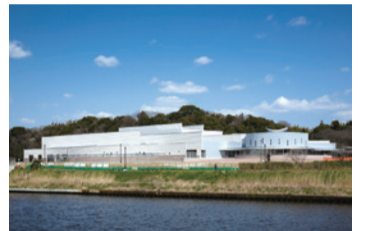
▲新川から臨む中央図書館・市民ギャラリー