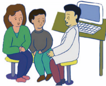
本人を無視して、介助者や付き添いの人だけに話しかける