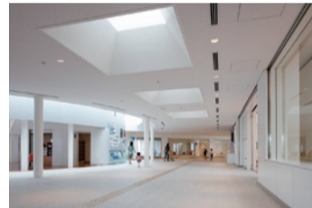
▲光が降り注ぐエントランスホール

54点の応募作品の中から選ばれ、一般建築物の部で入賞を受賞しました。3月23日の表彰式では、天空光をうまく取り入れ、子ども、高齢者、障害者も安心して使える、明るく快適な空間を実現していると評価されました。毎週末は大勢の利用者で賑わっています。