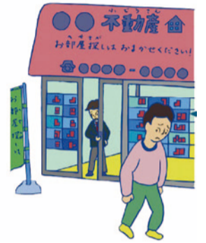
障害者向け物件はないと言って対応しない