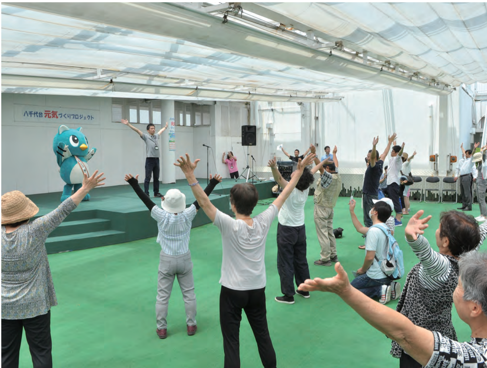
▲「やちよ元気体操」では、新バージョン「ふれあい編」も紹介され、ユアエルの屋上に集まった市民とやちよと一緒に気持ちの良い汗を流しました

地区人口の約3割が65歳以上を占め、高齢化が進む八千代台地域。市では、コミュニティバスを活用した外出の機会を増やし、地域の皆さんにいつまでも健康でいてもらいたいとの思いから、6月12日、取り組みに賛同した(株)ユアエルム京成などの民間事業者と共同で「八千代台元気づくりプロジェクト」を開催しました。会場のユアエルム八千代台では、八千代市オリジナルの健康づくり体操である「やちよ元気体操」を実施。また、健康や介護の相談ブースを設けたほか、京成バス(株)によるバス模型の販売、セントラルフィットネスクラブ八千代台による筋肉量・体脂肪測定も行われました。