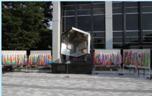
▲平和記念碑の左右に展示された千羽鶴