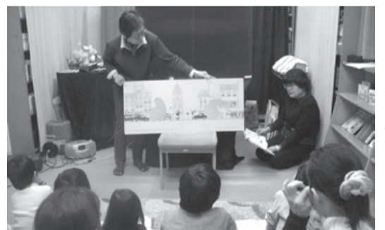
◀おはなし会の様子

図書館では、本の貸し出しのほか、赤ちゃんや小学生までを対象とした「おはなし会」、また、映画会や各種講座などを開催しています。日程は、図書館ホームページ、広報やちよなどでお知らせします。