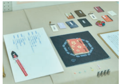
▲戦中の食事日記と内容(手前)。展示に温かみを添える日記のミニチュア(奥)