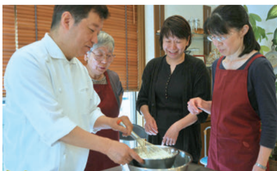
パティスリーランパルフェ 大和田新田 476-8 ☎ 450-0599