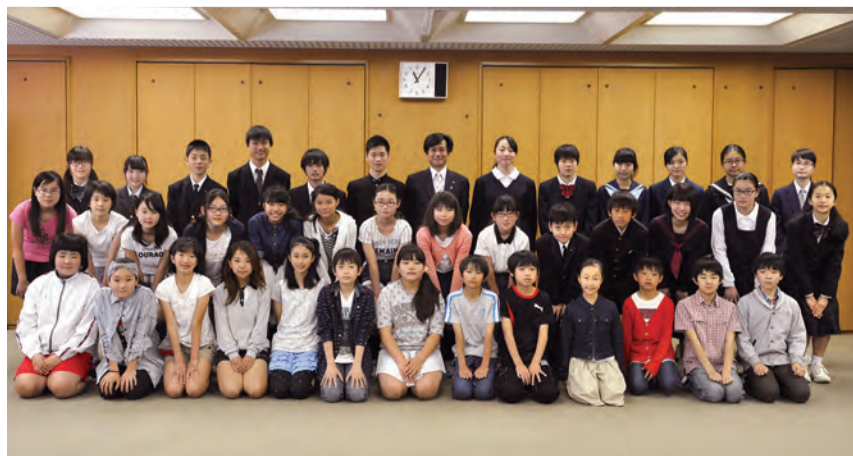
5月8日に市役所で委嘱式が開催されました

市内の小・中・高校の推薦で、28年度の広報青少年版記者41人が選ばれました。特集テーマに沿った自分の考え、学校での出来事や話題、新聞やニュースで気になることを報告。今年度は、今号、12月1日号、29年2月1日号に掲載します。