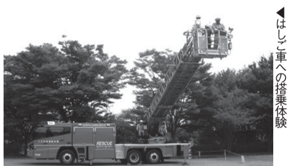
▶はしご車への搭乗体験

■消防・警察・自衛隊車両の展示 消防・警察・自衛隊による関係車両の展示や、はしご車先端バケットへの搭乗体験を実施します。