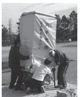
▶仮設トイレの組み立て

■災害用仮設トイレ組立て訓練 市の防災倉庫に備蓄している災害用仮設トイレを組み立てます。