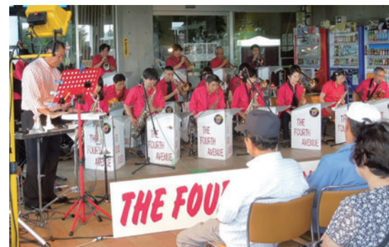
▲昨年のジャズコンサートの様子

申し込み不要、直接会場へお越しください。 ▶日時 9月25日(日)①午後1時30分から、②午後3時から ▶場所 ふるさとステーションピロティ