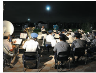
栈敷席での消防音楽隊による演奏。「ハイ・タッチ〜やちよのテーマ〜」など2曲を披露。