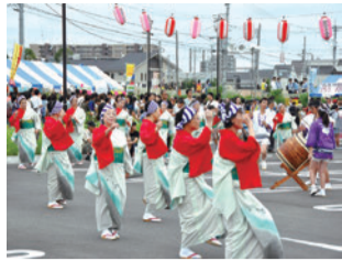
中央図書館前での盆踊り。来場者も一緒になって踊りました。