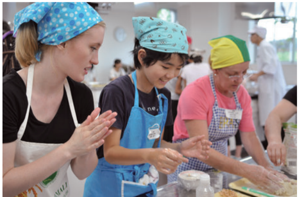
▲コシーニャ(ブラジル風コロッケ)の形をみんなで整えます