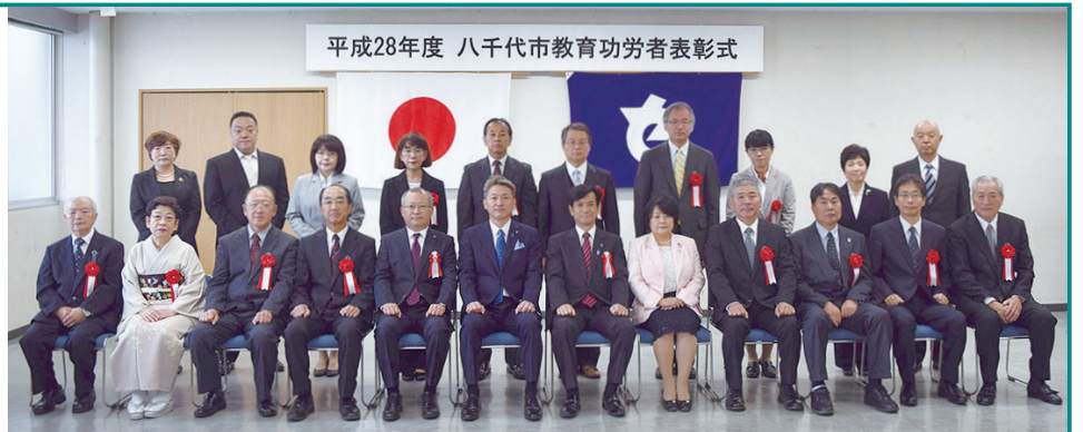
平成28年度 八千代市教育功労者表彰式