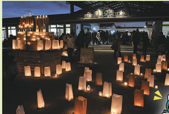
◀去年は千本を灯しました

▶日時 12月23日(祝)午後3時～7時 ▶場所 やちよ農業交流センター ▶問い合わせ わっか事務局(株ダイビーム内) ☎481-1208へ