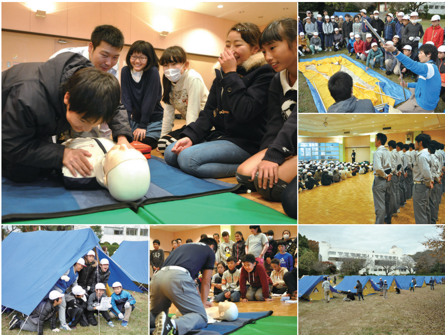
▲11月16日～17日に少年自然の家で行われた防災体験宿泊学習

救急車が到着するまでの間に何をすべきか、家が壊れたときのテント生活がどのようなものか、知っていますか。いつ起こるか分からない災害に備えて、勝田台小学校の6年生が、救命救急や応急処置、テント設営や宿泊、野外炊事などの防災体験宿泊学習を行いました。中でも、消防署の協力により隊員12人から直接指導を受けた救命救急講習は、市内の小中学校で初めてとなる試みです。受講した児童は、「(胸骨圧迫を)一人でするのはきつい。周りの人と協力して行うことが大事だとわかった」と前よりも頼もしい表情で話していました。命を救う大変さを体験した2日間になりました。